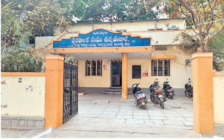
రాగన్నగూడ వార్డు కార్యాలయం