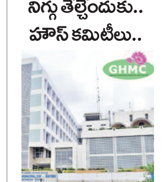
సీటీబియూలో, మార్చి 4 (నమస్తే తెలంగాణ): బిల్డియోలో పారిశుధ్యం, ప్రకటన విభాగంలో అక్రమాలను నిగ్గు తేల్చేందుకు రెండు హాన్ కమిటీలు ఏర్పాటుయ్యాయి.

సీటీబియూలో, మార్చి 4 (నమస్తే తెలంగాణ): బిల్డియోలో పారిశుధ్యం, ప్రకటన విభాగంలో అక్రమాలను నిగ్గు తేల్చేందుకు రెండు హాన్ కమిటీలు ఏర్పాటుయ్యాయి. ఆర్డీబి, అడ్మినిస్ట్రేటివ్ కోర్టు, జిఎంఎస్ బజారుకు వందల కోట్లను రెండవ పట్టణం కార్యక్రమంలో అక్రమాలను నిగ్గు తేల్చేందుకు రెండు హాన్ కమిటీలు ఏర్పాటుయ్యాయి.