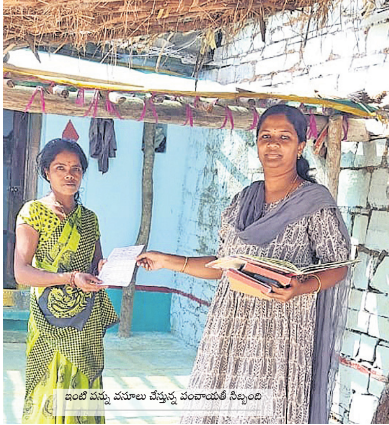
ఇంటి పన్ను వసూలు చేస్తున్న పంచాయతీ సెక్యూరిటీ

పరిధిలో ఉండే చిన్న చిన్న సమస్యలను మండల అధికారులు దృష్టికి తీసుకురావాలన్నారు. రానున్న వేసవిలో ప్రజలకు తాగునీటి ఇబ్బందులు తలెత్తకుండా ముందస్తు చర్యలు చేపట్టాలని ఆదేశించారు.