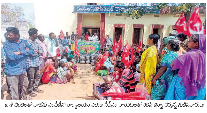
ఖాళీ బిందెలతో వాజేడు ఎంపీడీవో కార్యాలయం ఎదుట సీఎం నాయకులతో కలిసి ధర్నా చేస్తున్న గుడిసెవాసులు

గెలిపించాలని కోరారు. కేంద్రంలో ఉన్న బీజేపీ సర్కారు రాష్ట్రానికి చేసేందేమీ లేదనే విషయాన్ని ప్రజలకు వివరించాలన్నారు. అదేవిధంగా ఇటీవల అనేక అసత్య వాగ్దానాలు చేసి అధికారంలోకి వచ్చిన కాంగ్రెస్ పార్టీ, సంక్షేమ పథకాల అమలులో చేస్తున్న జాప్యాన్ని ప్రజలకు వివరించాలని నుచించారు. అందుకు కట్టుడి పనిచేసి చూసుకోవటమే మూడోసారి గులాబీ జైండా ఎగరేయాలన్నారు. ఎంపీ కవిత మాట్లాడుతూ మహిళాబాబాద్ పార్లమెంట్ అభ్యర్థిగా మరోసారి తనకు అవకాశం ఇచ్చిన అధినేత కేసీఆర్కు ఎంపీ కవిత ప్రత్యేక కృతజ్ఞతలు తెలిపారు. కేసీఆర్ను జీవితాంతం రుణపడి ఉంటానన్నారు. సమావేశంలో ఉమ్మడి జిల్లా నుంచి ఎమ్మెల్యేలు సత్కరణకొరెడ్డి, తక్కువల్లి రవీంద్రరావు, రాజ్కుమార్ సర్వయ్య వద్దిరాజు రవిచంద్ర, మాజీ ఎమ్మెల్యేలు పిల్ల సుధాకర్, రెడ్డి, రెడ్డి, రెడ్డి, రెడ్డి, శంకర్ నాయక్, హరిప్రియానాయక్, మాజీ ఎంపీ సీతారాంనాయక్, బడే నాగేశ్వర్రి పాల్గొన్నారు.