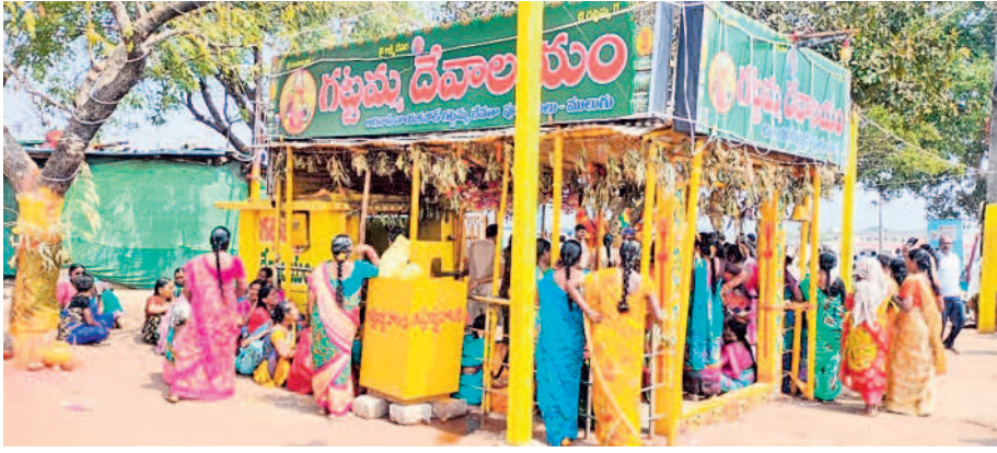
అలయం వద్ద ఇరువర్గాల వాగ్దానం