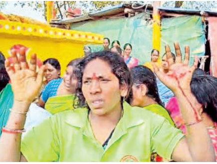
గాయాలను చూపిస్తున్న నాయకపోదు మహిళా పూజారి

ములుగు గట్టమ్మ దేవాలయంపై పట్టు కోసం జాకారానికి చెందిన ముదిరాజీలు, గ్రామస్తులు, ములుగు అదివాసీ నాయకపోదులు పూజారుల మధ్య సోమవారం ఘర్షణ జరిగింది. అలయం వద్ద పూజాలో ఉన్న నాయకపోదు మహిళలకు గాయాలయ్యాయి. పిచ్చయం తెలిసి డిఎస్పీ రవీంద్రుడు, ములుగు,