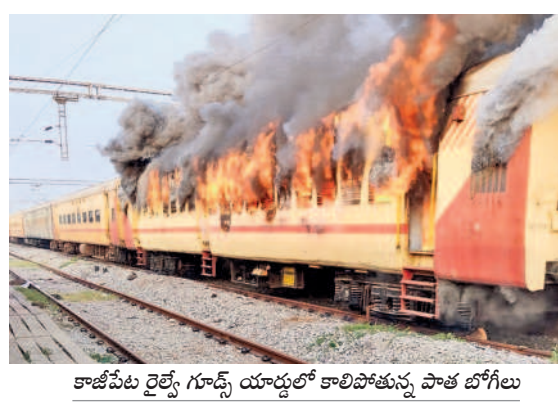
కాజీపేట రైల్వే గూడ్స్ యార్డులో కాలిపోతున్న పాత బోగీలు

రాణాలో రాడీ షీటర్ జన్మదిన వేడుకలు మొగళ్లపల్లి, మార్చి 5 : జయశంకర్ భూపాలపల్లి జిల్లాలోని ఓ రాజాలో ఎన్నె ఆధ్వర్యంలో రాడీ షీటర్ జన్మదిన వేడుకలు నిర్వహించిన పుటల సోపర్ల మీడియాలో చిరలేగా మారింది. విషయం తెలుసుకున్న జిల్లా పోలీస్ ఉన్నతాధికారి సదరు ఎన్నెను మండలించి సరి తిరిపింది. వివరాల్లోకి వెళ్తే.. బిట్టాల సర్కిల్ పరిధిలోని ఓ పోలీస్ స్టేషన్ లో రెండు రోజుల క్రితం రాడీ షీటర్ జన్మదినం సందర్భంగా కొందరితో కలిసి పోలీస్ స్టేషన్ కు వెళ్లారు. రాడీ షీటర్ ఎన్నె సామాజిక వర్గానికి చెందిన నవాబు కావడంతో అందరు కలిసి రాజాలో కేక్ కట్ చేసి వేడుకలు జరుపుకొన్నారు. దీనిని కొందరు పోలీసు తీసి సోపర్ల మీడియాలో ఫైవర్ చేయడంతో జిల్లా ఉన్నతాధికారి ఎన్నెని పిలిపించి తీవ్రంగా మందలించినట్లు సమాచారం. కాగా అతను రాడీ షీటర్ అనే విషయం తనకు తెలియదని ఎన్నె సంజాయిషీ ఇచ్చుకున్నట్లు తెలిసింది.