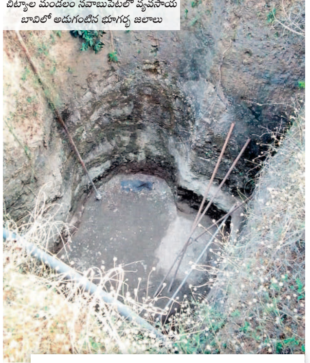
బిట్టాల మండలం నవాబుపేటలో వ్యవసాయ బావిలో అడుగంటిన భూగర్భ జలాలు

అన్నదాతలకు మళ్ళీ పాత రోజులు వస్తున్నాయి. చెరువులు, కుంటల్లో నీళ్లు అడుగంటి.. బోర్లు, బావులు ఎండిపోయి సాగుపై ఆశలు సన్నగిల్లుతున్నాయి. ఓవైపు మానేరు ఎండిపోవడం, డిబీఎం 38 కాలువ ద్వారా ఎన్నారెన్సీ నీళ్లు రాకపోవడంతో వ్యవసాయానికి గడ్డు పరిస్థితులు ఎదురవుతున్నాయి. కేసీఆర్ ప్రభుత్వం కాశ్మీరం ప్రాజెక్టు ద్వారా నీళ్లందించి వ్యవసాయాన్ని సస్యశ్యామలం చేస్తే ప్రస్తుత ప్రభుత్వం పట్టించుకోలేని తనంతో కళ్లుమూత పంటలు ఎండిపోతుండడంతో రైతుల్లో ఆందోళన నెలకొంటున్నది.