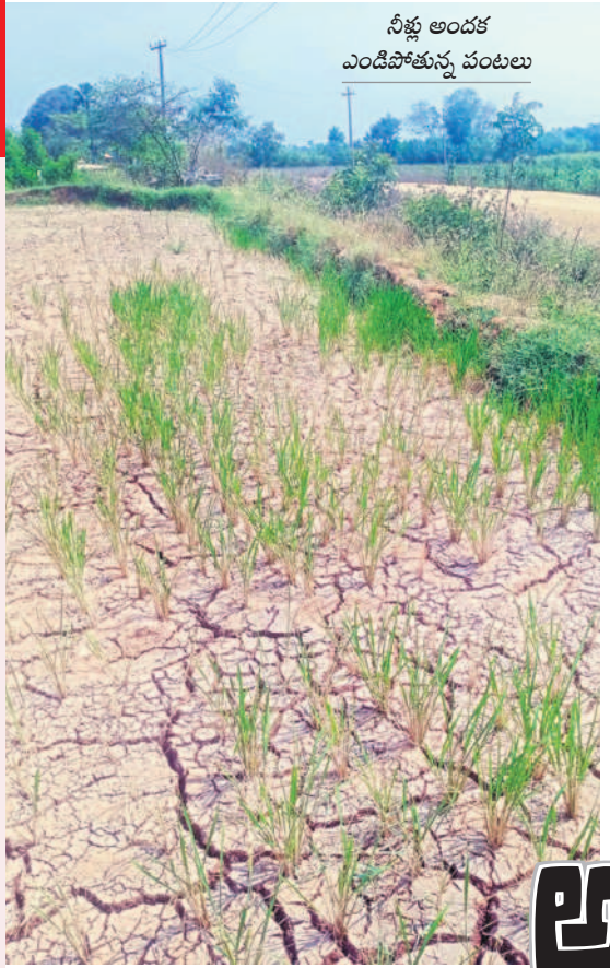
నీళ్లు అందక ఎండిపోతున్న పంటలు