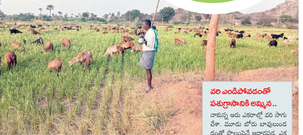
నీళ్లులేక ఎండిన వరిని మేస్తున్న గొర్రెలు