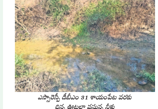
ఎన్నారెన్సీ డిబీఎం 31 శాయంపేట వరకు చిన్న ఊటాలు వస్తున్న నీళ్లు

రాణాలో రాడీ షీటర్ జన్మదిన వేడుకలు మొగళ్లపల్లి, మార్చి 5 : జయశంకర్ భూపాలపల్లి జిల్లాలోని ఓ రాజాలో ఎన్నె ఆధ్వర్యంలో రాడీ షీటర్ జన్మదిన వేడుకలు నిర్వహించిన పుటల సోపర్ల మీడియాలో చిరలేగా మారింది. విషయం తెలుసుకున్న జిల్లా పోలీస్ ఉన్నతాధికారి సదరు ఎన్నెను మండలించి సరి తిరిపింది. వివరాల్లోకి వెళ్తే.. బిట్టాల సర్కిల్ పరిధిలోని ఓ పోలీస్ స్టేషన్ లో రెండు రోజుల క్రితం రాడీ షీటర్ జన్మదినం సందర్భంగా కొందరితో కలిసి పోలీస్ స్టేషన్ కు వెళ్లారు. రాడీ షీటర్ ఎన్నె సామాజిక వర్గానికి చెందిన నవాబు కావడంతో అందరు కలిసి రాజాలో కేక్ కట్ చేసి వేడుకలు జరుపుకొన్నారు. దీనిని కొందరు పోలీసు తీసి సోపర్ల మీడియాలో ఫైవర్ చేయడంతో జిల్లా ఉన్నతాధికారి ఎన్నెని పిలిపించి తీవ్రంగా మందలించినట్లు సమాచారం. కాగా అతను రాడీ షీటర్ అనే విషయం తనకు తెలియదని ఎన్నె సంజాయిషీ ఇచ్చుకున్నట్లు తెలిసింది.