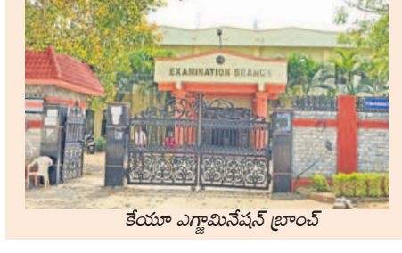
కేయా ఎగ్జామినేషన్ ట్రాంక్

హాల్ టికెట్లు ఎప్పుడిస్తారు? నేటి నుంచే ఎల్ ఎల్ సి మొదలై పరీక్షలు హాల్ టికెట్లు అందక అయోమయంలో విద్యార్థులు హనుమకొండ చౌరస్తా, మార్చి 5 : కేయా పరీక్షల విభాగం అధికారుల నిర్ణయం విద్యార్థులకు శాపంగా మారింది. బుధవారం నుంచి ఎల్ఎల్సి పరీక్షల ప్రారంభం జరుగుతున్నాటికి ఇంకా హాల్ టికెట్లు ఇవ్వకపోవడంపై ఆందోళన చెందుతున్నారు. మూడేళ్ల ఎల్ఎల్సి కోర్సుల్లో 3, 7, 9 సెమిస్టర్లు, ఐదేళ్ల ఎల్ఎల్సి కోర్సుల్లో 3, 7, 9 సెమిస్టర్ల పరీక్షలు బుధవారం మధ్యాహ్నం 2 నుంచి సాయంత్రం 5 గంటల వరకు జరుగుతున్నాయి. అయితే ఇప్పటివరకు హాల్ టికెట్లు అవేలోడి చేయక విద్యార్థులు తీవ్ర ఇబ్బందులు పడుతున్నారు. గత నెల 18న పరీక్ష షీట్లు కట్టించుకున్నప్పటికీ అధికారులు హాల్ టికెట్లు మాత్రం అందజేయడంలో నిర్లక్ష్యంగా వ్యవహరిస్తున్నారని ఆవేదన వ్యక్తం చేశారు. కాగా, హాల్ టికెట్లు విషయంపై కేయా పరీక్షల నియంత్రణాధికారి నర్సయ్యారాని వివరణ అడుగగా తెలుసుకొని పంపిస్తామని సమాధానమిచ్చారు.