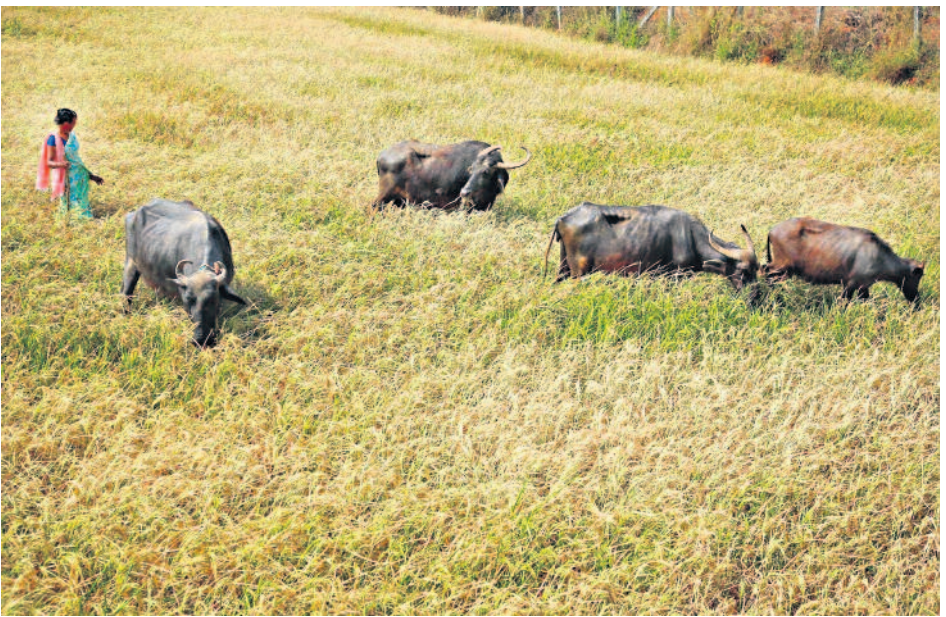
నల్లగొండ మండలం కేకరాజుపల్లి గ్రామంలో సాగునీరు లేక ఎండిపోయిన పరి పొలంలో బరెలను మేపుతున్న మహిళా రైతు

గౌరెల పంపిణీపై విజి 'లెన్స్' సమగ్ర విచారణకు సీఎం ఆదేశం అమలు తీర్పు అనుమానాలు అవినీతి తేలికే ఏసీబీకి అప్పగించ > 6