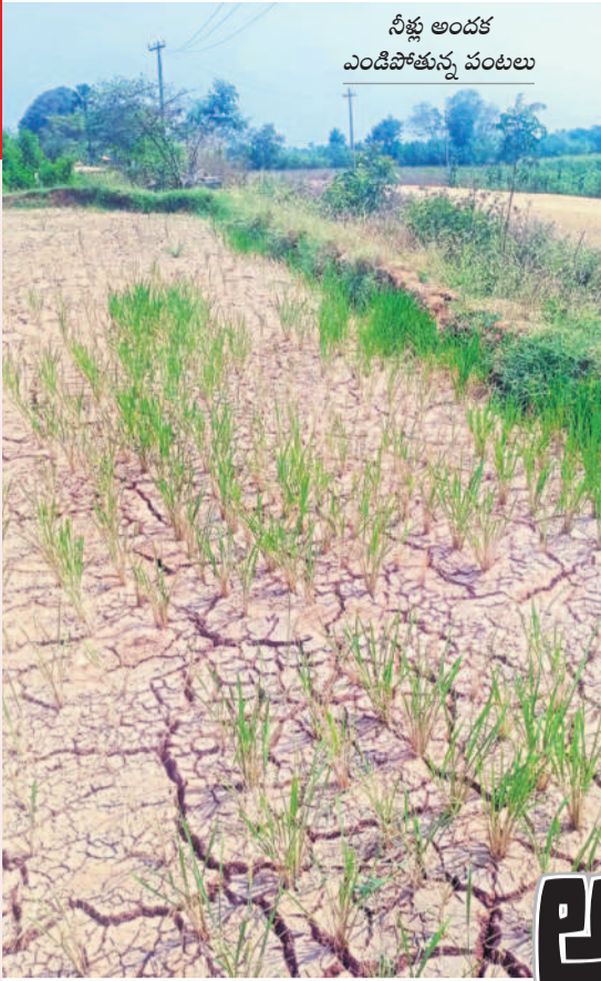
నీళ్లు అందక ఎండిపోతున్న పంటలు