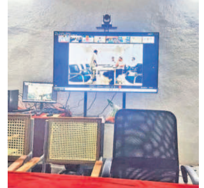
పరిపాలనా రైతువేదికల్లో ప్రయోగాత్మకంగా ఏర్పాటు చేసిన అధికారులు

అన్నదాతలకు 'వీడియో' సలహాలు రైతువేదికల్లో వీడియో కాన్ఫరెన్స్ కు ఏర్పాటు నేడు ప్రారంభించనున్న సీఎం రేవంత్ రెడ్డి గతంలో భీమవరపల్లి మండలంలో విజయవంతం హనుమకొండ సభల్లో, మార్చి 5 : వ్యవసాయ రంగంలో సాంకేతికతను అందించుకునేందుకు ప్రభుత్వం సరికొత్తగా ఆలోచిస్తున్నది. ఈమేరకు గత ప్రభుత్వ హయాంలో నిర్మించిన రైతువేదికల్ కేంద్రంగా వీడియో సలహాలు ఇవ్వాలని నిర్ణయించింది. ఈమేరకు వీడియో కాన్ఫరెన్స్ ద్వారా శాస్త్రవేత్తలు, వ్యవసాయ రంగ నిపుణుల సలహాలు, నూతన లతో పాటు పంట క్రైతంలో రైతులు ఎదురొచ్చే సమస్యలను నేరుగా తెలుసుకొని తగిన సూచనలు ఇచ్చేందుకు ఏర్పాటు చేస్తోంది. తొలి విడతగా నియోజవర్గానికి ఒక నెంబర్లను ఎంపిక చేశారు. వీటిని ఆన్లైన్ ద్వారా ప్రయోగాత్మకంగా ఆన్లైన్ సలహా కేంద్రాన్ని ఏర్పాటు చేస్తున్నారు. జిల్లాకు సంబంధించి హనుమకొండ మండలం పరిపాలనా క్షేత్రంలో నిర్మించిన రైతువేదికల్ ఆన్లైన్ ఏర్పాటు చేయగా మంగళవారం కలెక్టర్ సికాపట్నాయక్, అదనపు కలెక్టర్ రాధికాంబ పరీక్షించారు.