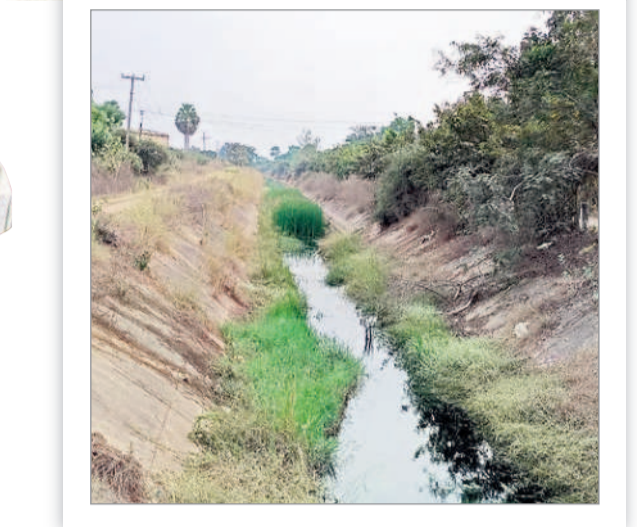
రేగండ వద్ద వెలవెలపోతున్న డిబీఎం 38 కాలువ

జయశంకర్ భూపాలపల్లి, మార్చి 5 (నమస్తే తెలంగాణ) : జయశంకర్ భూపాలపల్లి జిల్లాలో భూగర్భ జలాలు ఇంకాపోతున్నాయి. ఎండకాలం ముందే జలం పాతాళానికి పడిపోతుండడం ప్రజలకు అపరాధం తాగునీటికి తిప్పలు తప్పేలా లేవు. ప్రస్తుతం అవరేఖా 0.72 మీటర్ల లోతులోకి భూగర్భ జలాలు పడిపోయాయి. భూపాలపల్లి, మల్లర్ మండలంలో భూగర్భ జలాలు అడుగంటాయి. గతేడాది జనవరి, గడిచిన జనవరితో పోలిస్తే 0.72 మీటర్ల లోతులోకి నీటిమట్టం పడిపోయింది. యాసంగిలో భూగర్భ జలాలు అందనంతే పోలిస్తే 0.72 మీటర్ల లోతులోకి నీటిమట్టం పడిపోయింది. యాసంగిలో భూగర్భ జలాలు అందనంతే పోలిస్తే 0.72 మీటర్ల లోతులోకి నీటిమట్టం పడిపోయింది. యాసంగిలో భూగర్భ జలాలు అందనంతే పోలిస్తే 0.72 మీటర్ల లోతులోకి నీటిమట్టం పడిపోయింది.