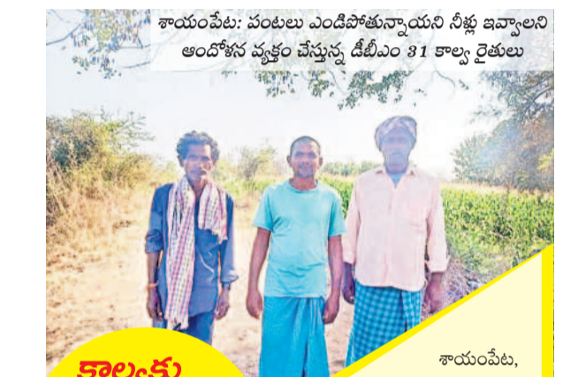
శాయంపేట: పంటలు ఎండిపోతున్నాయని నీళ్లు ఇవ్వాలని ఆందోళన వ్యక్తం చేస్తున్న డిబీఎం 31 కాల్వ రైతులు

కాల్యాలకు నీళ్లు వున్నా ఇస్తారు..? శాయంపేట, మార్చి 5 : హనుమ కొండ జిల్లా శాయంపేట మండలంలోని కొత్తగట్టుసింగారం నుంచి శాయంపేట వరకు ఉన్న ఎన్నారెస్సీ డిబీఎం-31 కాల్వకు నీళ్లు అందక వెయ్యి ఎకరాల్లో మక్కజొన్న పంట ఎండిపోతున్నదని, వెంటనే సీరందించాలని రైతులు మంగళవారం ఆందోళన వ్యక్తం చేశారు. కాల్వ కింద రైతులు ఎన్నారెస్సీ నీళ్లు వస్తాయన్న ఆశతో వేలల్లో పెట్టుబడి పెట్టి పెద్ద ఎత్తున మక్కజొన్న వేశారు. అయితే 15 రోజులుగా కాల్వ నీళ్లు అందడం లేదని చిన్న ఊట లెక్క వస్తుండడంతో పంటలు ఎండిపోతున్నాయని ఆందోళన వ్యక్తం చేశారు. పరేఖా కాల్వ నీళ్లు వస్తున్నాయని, ఎప్పటిలాగే ఈసారి కూడా అదే సమస్యతో యాసంగిలో మక్కజొన్న వేస్తే నీళ్లు మాత్రం అందడం లేదని చెప్పారు. గత ప్రభుత్వంలో నీళ్లు పుష్కలంగా వచ్చేవని కానీ ప్రభుత్వం మారిన తర్వాత అధికారులవరకూ పట్టించుకోవడం లేదని, వారం గడువు పెట్టి నీళ్లు ఇస్తామంటున్నారని కానీ రావడం లేదని చెప్పారు. గతంలో పెద్దకడెపాక, చలివాగు వరకు నీళ్లు అందేవని మరో ఐదు రోజులు వెంచి బివర్ వరకు నీళ్లు ఇవ్వాలని కోరారు. సింగారం నుంచి శాయంపేట డిబీఎం-31 కాల్వపై ఆధారపడి 700 నుంచి వెయ్యి ఎకరాల సాగు చేశామని, నీళ్లు లేక ఎండిపోతున్నదని వాపోయారు. వెంటనే నీళ్లు ఇవ్వకపోతే పంటలు ఎండిపోవడం భాయమని ఆవేదన వ్యక్తం చేశారు.