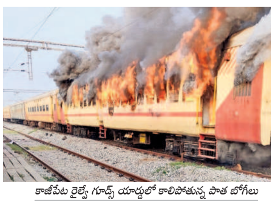
కాజీపేట రైల్వే గూడ్స్ యార్డులో కాలిపోతున్న పాత బోగీలు

రాణాలో రాడీ షీటర్ జన్మదిన వేడుకలు మొగళ్లపల్లి, మార్చి 5 : జయశంకర్ భూపాలపల్లి జిల్లాలోని ఓ రాజాలో ఎన్నె ఆధ్వర్యంలో రాడీ షీటర్ జన్మదిన వేడుకలు నిర్వహించిన పుటల సోపర్ మీడియాలో చైరల్ గా మారింది. విషయం తెలుసుకున్న జిల్లా పోలీస్ ఉన్నతాధికారి సదరు ఎన్నెను మండలించి సరి తిరిపింది. వివరాల్లోకి వెళ్తే.. చిట్టాల సర్కిల్ పరిధిలోని ఓ పోలీస్ స్టేషన్ లో రెండు రోజుల త్రితం రాడీ షీటర్ జన్మదినం ప్రసారం కావడంతో అందరు కలిసి పోలీస్ స్టేషన్ కు వెళ్లారు. రాడీ షీటర్ ఎన్నె సామాజిక వర్గానికి చెందిన నవాబు కావడంతో అందరు కలిసి రాజాలో కేక్ కట్ చేసి వేడుకలు జరుపుకొన్నారు. దీనిని కొందరు 'బాబోలు' తీసి సోపర్ మీడియాలో చైరల్ చేయడంతో జిల్లా ఉన్నతాధికారి ఎన్నెని పిలిపించి తీవ్రంగా మందలించినట్లు సమాచారం. కాగా అతను రాడీ షీటర్ అనే విషయం తనకు తెలియదని ఎన్నె సంజాయిషీ ఇచ్చుకున్నట్లు తెలిసింది.