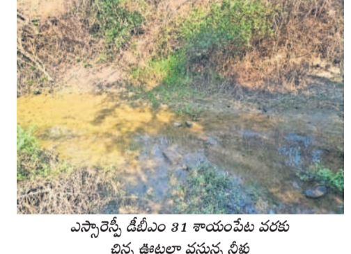
ఎన్నారెస్సీ డిబీఎం 31 శాయంపేట వరకు చిన్న ఊటాలు వస్తున్న నీళ్లు

రాణాలో రాడీ షీటర్ జన్మదిన వేడుకలు మొగళ్లపల్లి, మార్చి 5 : జయశంకర్ భూపాలపల్లి జిల్లాలోని ఓ రాజాలో ఎన్నె ఆధ్వర్యంలో రాడీ షీటర్ జన్మదిన వేడుకలు నిర్వహించిన పుటల సోపర్ మీడియాలో చైరల్ గా మారింది. విషయం తెలుసుకున్న జిల్లా పోలీస్ ఉన్నతాధికారి సదరు ఎన్నెను మండలించి సరి తిరిపింది. వివరాల్లోకి వెళ్తే.. చిట్టాల సర్కిల్ పరిధిలోని ఓ పోలీస్ స్టేషన్ లో రెండు రోజుల త్రితం రాడీ షీటర్ జన్మదినం ప్రసారం కావడంతో అందరు కలిసి పోలీస్ స్టేషన్ కు వెళ్లారు. రాడీ షీటర్ ఎన్నె సామాజిక వర్గానికి చెందిన నవాబు కావడంతో అందరు కలిసి రాజాలో కేక్ కట్ చేసి వేడుకలు జరుపుకొన్నారు. దీనిని కొందరు 'బాబోలు' తీసి సోపర్ మీడియాలో చైరల్ చేయడంతో జిల్లా ఉన్నతాధికారి ఎన్నెని పిలిపించి తీవ్రంగా మందలించినట్లు సమాచారం. కాగా అతను రాడీ షీటర్ అనే విషయం తనకు తెలియదని ఎన్నె సంజాయిషీ ఇచ్చుకున్నట్లు తెలిసింది.