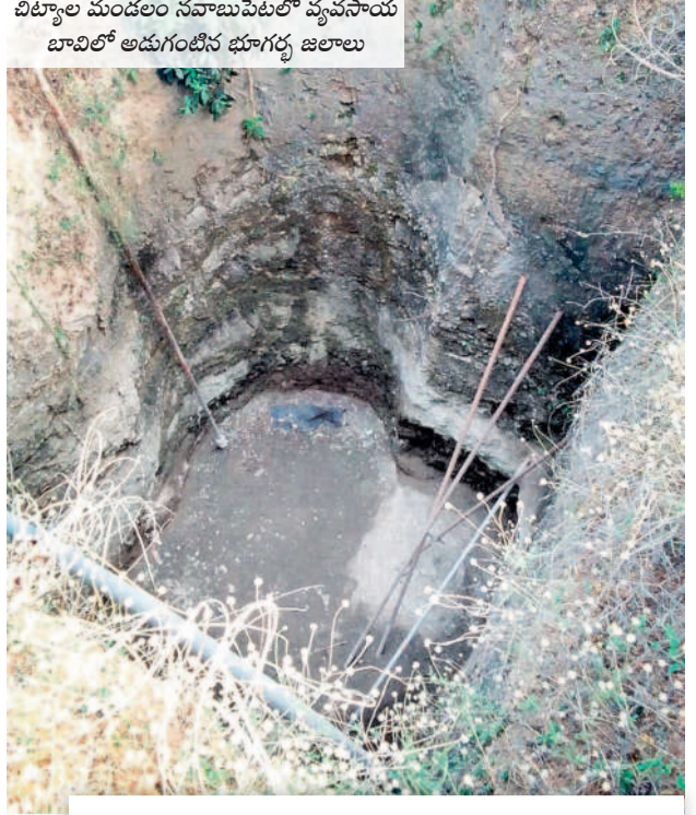
చిట్టాల మండలం నవాబుపేటలో వ్యవసాయ బావిలో అడుగంటిన భూగర్భ జలాలు

అన్నదాతలకు మళ్ళీ పాత రోజులు వస్తున్నాయి. చెరువులు, కుంటల్లో నీళ్లు అడుగంటి.. బోర్లు, బావులు ఎండిపోయి సాగుపై ఆశలు సన్నగిల్లుతున్నాయి. ఓవైపు మానేరు ఎండిపోవడం, డిబీఎం 38 కాలువ ద్వారా ఎన్నారెస్సీ నీళ్లు రాకపోవడంతో వ్యవసాయానికి గడ్డు పరిస్థితులు ఎదురవుతున్నాయి. కేసీఆర్ ప్రభుత్వం కాశ్మీరం ప్రాజెక్టు ద్వారా నీళ్లందించి వ్యవసాయాన్ని సస్యశ్యామలం చేస్తే ప్రస్తుత ప్రభుత్వం పట్టించుకోవడం కళ్లుమూత పంటలు ఎండిపోతుండడంతో రైతుల్లో ఆందోళన నెలకొంటున్నది.