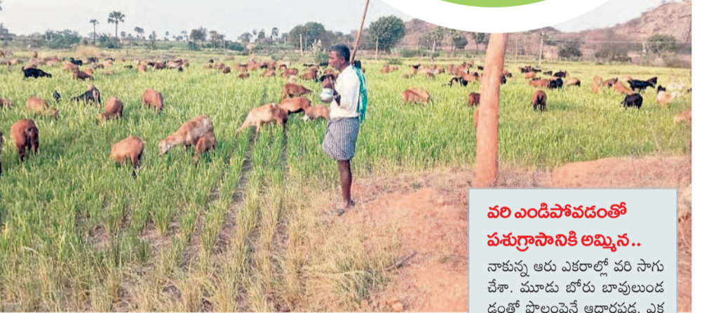
నీళ్లులేక ఎండిన వరిని మేస్తున్న గొర్రెలు

కాల్యాలకు నీళ్లు వున్నా ఇస్తారు..? శాయంపేట, మార్చి 5 : హనుమ కొండ జిల్లా శాయంపేట మండలంలోని కొత్తగట్టుసింగారం నుంచి శాయంపేట వరకు ఉన్న ఎన్నారెస్సీ డిబీఎం-31 కాల్వకు నీళ్లు అందక వెయ్యి ఎకరాల్లో మక్కజొన్న పంట ఎండిపోతున్నదని, వెంటనే సీరందించాలని రైతులు మంగళవారం ఆందోళన వ్యక్తం చేశారు. కాల్వ కింద రైతులు ఎన్నారెస్సీ నీళ్లు వస్తాయన్న ఆశతో వేలల్లో పెట్టుబడి పెట్టి పెద్ద ఎత్తున మక్కజొన్న వేశారు. అయితే 15 రోజులుగా కాల్వ నీళ్లు అందడం లేదని చిన్న ఊట లెక్క వస్తుండడంతో పంటలు ఎండిపోతున్నాయని ఆందోళన వ్యక్తం చేశారు. పరేఖా కాల్వ నీళ్లు వస్తున్నాయని, ఎప్పటిలాగే ఈసారి కూడా అదే సమస్యతో యాసంగిలో మక్కజొన్న వేస్తే నీళ్లు మాత్రం అందడం లేదని చెప్పారు. గత ప్రభుత్వంలో నీళ్లు పుష్కలంగా వచ్చేవని కానీ ప్రభుత్వం మారిన తర్వాత అధికారులవరకూ పట్టించుకోవడం లేదని, వారం గడువు పెట్టి నీళ్లు ఇస్తామంటున్నారని కానీ రావడం లేదని చెప్పారు. గతంలో పెద్దకడెపాక, చలివాగు వరకు నీళ్లు అందేవని మరో ఐదు రోజులు వెంచి బివర్ వరకు నీళ్లు ఇవ్వాలని కోరారు. సింగారం నుంచి శాయంపేట డిబీఎం-31 కాల్వపై ఆధారపడి 700 నుంచి వెయ్యి ఎకరాల సాగు చేశామని, నీళ్లు లేక ఎండిపోతున్నదని వాపోయారు. వెంటనే నీళ్లు ఇవ్వకపోతే పంటలు ఎండిపోవడం భాయమని ఆవేదన వ్యక్తం చేశారు.