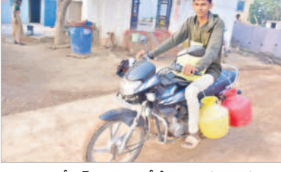
జంగంపల్లిలో బైక్ పై బిందెలతో నీళ్లు తెస్తున్న యువకుడు