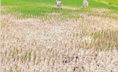
కేటీడాక్టో మండలం కొండాపూరు శివారులో ఎండిన చరి

ముసాపేట, మార్చి 5 : మహబూబ్ నగర్ జిల్లా దేవరకల్ల నియోజకవర్గంలో కేసీఆర్ ప్రభుత్వం పెట్టిన పెట్టుబడిని నిర్మించింది. సాగునీరు పుష్పలమైంది. మహబూబ్ నగర్ మండలం సంకలమద్ది - నిజాలూ పూర్ గ్రామాల శివారులో పావుతున్న పెద్దవార్డు రూ.5 కోట్లతో చెక్కెంను 2020 సంవత్సరంలో నిర్మించారు. దీంతో నిజాలూపూర్ పాడు, మహబూబ్ నగర్, సంకలమద్ది, మహబూబ్ నగర్ శివారులో భూగర్భ జలాలు ఒక్కసారిగా పెరిగిపోయాయి. బావులు సైతం నిండుగా దర్భనమిచ్చాయి. ఎక్కడ చూసినా సాగు జలాలు సన్నగిపోయాయి.. బంగాలు పంటలు పండాయి. అలాంటి నేల నేడు నీళ్లుగా మారింది. మొన్నటి దాకా బలక సంతరించుకున్న చెక్కెం ఒట్టిపోతున్నది. నీటి ప్రమాదం లేక పెద్దవార్డు వెలువెళ్తున్నది. తాగు, సాగునీటికి కష్టాలు మొదలయ్యాయి. వేసిన ప్రారంభంలోనే ప్రజలు నీటి కోసం తలదెబ్బకున్నారు.