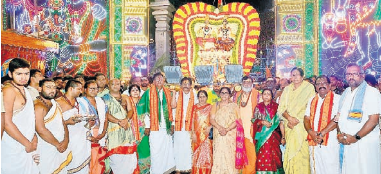
శ్రీశైలంలో స్వామి అమ్మవారికి రావణ వాహన సేవ నిర్వహిస్తున్న అలయ కమిటీ సభ్యులు