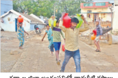
గద్వాల జిల్లా జంగంపల్లిలో తాగునీటి కష్టాలు

జంగంపల్లిలో దాహం దాహం. జోగులూరి గద్వాల జిల్లాలో సాగునీటితోపాటు తాగునీటి తరహా ప్రారంభమైంది. గతంలో ఎప్పుడూ లీనంతగా గత నెల నుంచే నీటి కష్టాలు మొదలు అయ్యాయి. జంగంపల్లిలో అయితే సాగు, తాగునీరు లేక రైతులు, ప్రజలు పడుతున్న బాధను వర్ణనాతికం. ఫిబ్రవరి ఒకటో తేదీతో సర్పంచరు పదవీ కాలం ముగియడం.. తర్వాత ప్రత్యేకాధికారులు బాధ్యతలు చేపట్టినా సమస్య దృష్టి సారించడం లేదని స్థానికులు ఆరోపిస్తున్నారు. మిషన్ భగీరథ సీట్ల సర్పరా కావడం లేదు.. దీంతో దాహంతో జనం తలదెబ్బపోతున్నారు. బిందెలు సైకిల్స్, బైక్లకు కట్టుకోని వ్యవసాయ బోర్డరు ఆశ్రయిస్తున్నారు. మహిళలు బిందెలతో రోడ్లెక్క వస్తున్నారు. నీటి కోసం పడుతున్న బాధలను 'నమస్తే తెలంగాణ' పాలోగ్రాఫర్ తన కెమెరాలో బయటపెట్టారు.