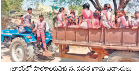
ట్రాక్టర్లో పాఠశాలకు వెళ్తున్న పచ్చర్ల గ్రామ విద్యార్థులు

రాజోలి, మార్చి 5 : జోగులూరి గద్వాల జిల్లా రాజోలి మండలం పచ్చర్ల చెందిన విద్యార్థులు ప్రతి రోజూ పాఠశాలకు వెళ్లేందుకు అనేక ఇబ్బందులు ఎదురవుతున్నాయి. ఒకటి నుంచి 7వ తరగతి వరకు గ్రామంలో చదువు అభ్యసించిన అనంతరం మనోదొడ్డి జిల్లా చరిపల్లె ఉన్నత పాఠశాలలో 8నుంచి 10వ తరగతి వరకు చదువుకునేందుకు 70 మంది చరిపల్లె విద్యార్థులు వెళ్తారు. పచ్చర్ల నుంచి మనోదొడ్డి వెళ్లేందుకు 7కిలోమీటర్ల దూరం ఉండగా, ఉదయం 10గంటలకు రావాల్సిన ఆర్టీసీ బస్సు 11:30గంటలకు వస్తున్నది. ఒక్కసారి బస్సు రాకపోవడంతో కొందరు కాలినడక చే వెళ్తున్నారు. మరొకొందరు చేసిన లేక బైక్లు, ఇతర వాహనాలను లిఫ్ట్ అడగి వెళ్తున్న చరిపల్లె వెళ్తున్నారు. దీంతో చేసిన లేక కొన్నాళ్ళు గ్రామస్థులు ట్రాక్టర్ ద్వారా విద్యార్థులను తరలిస్తున్నారు. సమయానికి బస్సు సౌకర్యం కల్పించాలని గద్వాల డిప్యూటీ మేనేజర్ ఎన్నిసార్లు విన్నవించినా పట్టించుకోవడం లేదని గ్రామస్థులు ఆరోపిస్తున్నారు. ఇప్పటికైనా స్పందించి రెగ్యులర్ గా బస్సు నడిపించాలని కోరుతున్నారు.