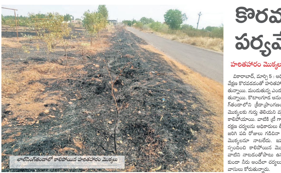
లాల్ నెంట్ కుండలో కాలిపోయిన హరితహారం మొక్కలు

హరితహారం మొక్కలు అగ్నికి ఆహుతి వికారాబాద్, మార్చి 5 : అధికారుల నిర్లక్ష్యం.. పర్యవేక్షణ కొరవడంతో హరితహారం మొక్కలు ఎండిపోతున్నాయి. మండలస్థాయి అంచలకు నీరందక మాడిపోగలగానేని క్రీడా ప్రాంగణం గ్రామం లాల్ నెంట్ నాలిన మొక్కలకు గుర్తు తెలియని వ్యక్తులు అగ్ని పెట్టడంతో కాలిపోయాయి. వాటికి శ్రీ గార్లు అతోపాటు ఎలాంటి రక్షణ చర్యలను అధికారులు తీసుకోలేదు. ఈ మటన జరిగి పది రోజులు గడిచినా వాటి స్థానంలో కొత్త మొక్కలనూ నాటలేదు. ఇప్పటికైనా అధికారులు స్పందించి కాలిపోయిన మొక్కల స్థానంలో కొత్త వాటిని నాటడంతోపాటు ఉన్న మొక్కలు ఎండిపోకుండా నీరు అందేలా చర్యలు తీసుకోవాలని తండా వాసులు కోరుతున్నారు.