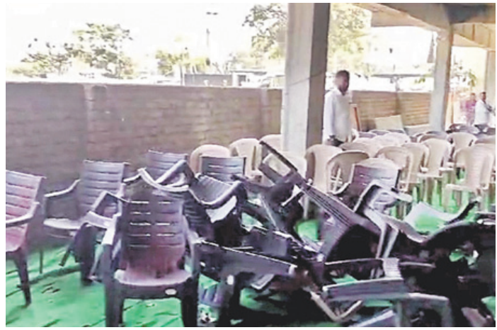
కాంగ్రెస్ కార్యక్రమాల గలాటలో విరిగిపోయిన కుర్చీలు

హైకమాండ్ ఒకటి తల్లి.. ఆసెంబ్లీ నిర్ణయం మేజూర్ సీట్లు సాధించిన కాంగ్రెస్ పార్టీ రాష్ట్రంలో ప్రభుత్వాన్ని ఏర్పాటు చేసింది. అయితే గ్రామాల్లో ఇప్పటికీ బీఆర్ఎస్ కే పట్టు ఉన్నది. ముఖ్యంగా సర్పంచ్ లు, మూజీ సర్పంచ్ లు, ఎంపీటీసీలు, ఇతర ప్రజాప్రతినిధులు బీఆర్ఎస్ కు చెందిన వారే అధికంగా ఉన్నారు. వారిని కాంగ్రెస్ లో చేర్చి