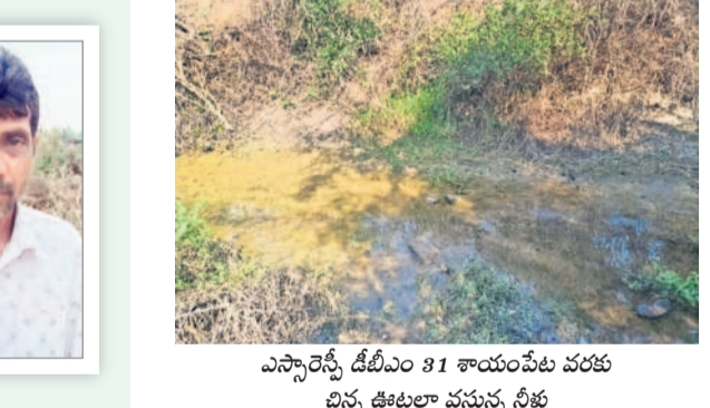
ఎన్నారెస్సీ డిబీఎం 31 శాయంపేట వరకు చిన్న ఊటాలు వస్తున్న నీళ్లు