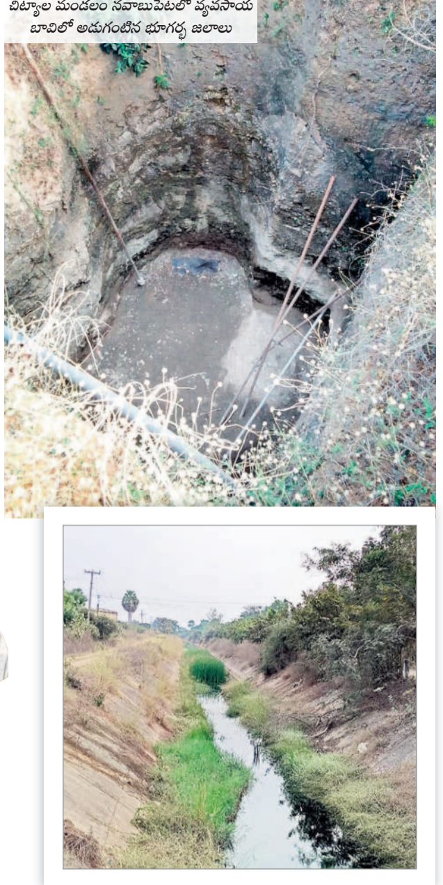
చిట్టాల మండలం నవాబుపేటలో వ్యవసాయ బావిలో అడుగంటిన భూగర్భ జలాలు

అన్నదాతలకు మళ్ళీ పాత రోజులు వస్తున్నాయి. చెరువులు, కుంటల్లో నీళ్లు అడుగంటి.. బోర్లు, బావులు ఎండిపోయి సాగుపై ఆశలు సన్నగిల్లుతున్నాయి. ఓవైపు మానేరు ఎండిపోవడం, డిబీఎం 38 కాలువ ద్వారా ఎన్నారెస్సీ నీళ్లు రాకపోవడంతో వ్యవసాయానికి గడ్డు పరిస్థితులు ఎదురవుతున్నాయి. కేసీఆర్ ప్రభుత్వం కాశ్మీరం ప్రాజెక్టు ద్వారా నీళ్లందించి వ్యవసాయాన్ని సస్యశ్యామలం చేస్తే ప్రస్తుత ప్రభుత్వం పట్టించుకోలేని తనంతో కళ్లుమూత పంటలు ఎండిపోతుండడంతో రైతుల్లో ఆందోళన నెలకొంటున్నది.