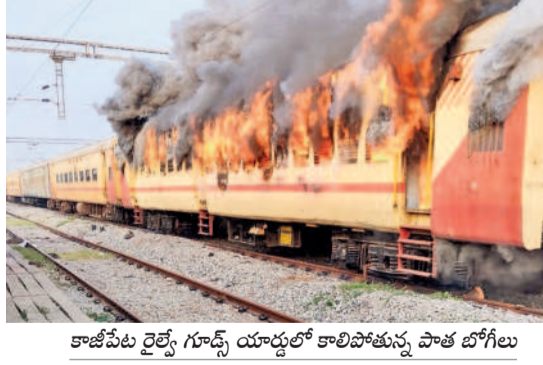
కాజీపేట రైల్వే గూడ్స్ యార్డులో కాలిపోతున్న పాత బోగీలు

మొగళ్లపల్లి, మార్చి 5 : జయశంకర్ భూపాలపల్లి జిల్లాలోని ఓ రాజాలో ఎన్నె ఆధ్వర్యంలో రాడీ షీటర్ జన్మదిన వేడుకలు నిర్వహించిన పుటల సోపర్ మీడియాలో చైరల్ గా మారింది. విషయం తెలుసుకున్న జిల్లా పోలీస్ ఉన్నతాధికారి సదరు ఎన్ఫోర్స్ మెంట్ మండలిని పంపింపించి సరి తిరిపింది. వివరాల్లోకి వెళ్తే.. చిట్టాల సర్కిల్ పరిధిలోని ఓ పోలీస్ స్టేషన్ లో రెండు రోజుల క్రితం రాడీ షీటర్ జన్మదినం ప్రసారం కావడంతో కలిసి పోలీస్ స్టేషన్ కు వెళ్లారు. రాడీ షీటర్ ఎన్నె సామాజిక వర్గానికి చెందిన నవాబు కావడంతో అందరు కలిసి రాజాలో కేక్ కట్ చేసి వేడుకలు జరుపుకొన్నారు. దీనిని కొందరు 'బాబ్'లు తీసి సోపర్ మీడియాలో చైరల్ చేయడంతో జిల్లా ఉన్నతాధికారి ఎన్నెని పిలిపించి తీవ్రంగా మందలించినట్లు సమాచారం. కాగా అతను రాడీ షీటర్ అనే విషయం తనకు తెలియదని ఎన్నె సంజాయిషీ ఇచ్చుకున్నట్లు తెలిసింది.