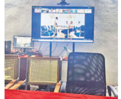
పరిపాలనా రైతువేదికల్లో ప్రయోగాత్మకంగా ఏర్పాటు చేసిన అధికారులు