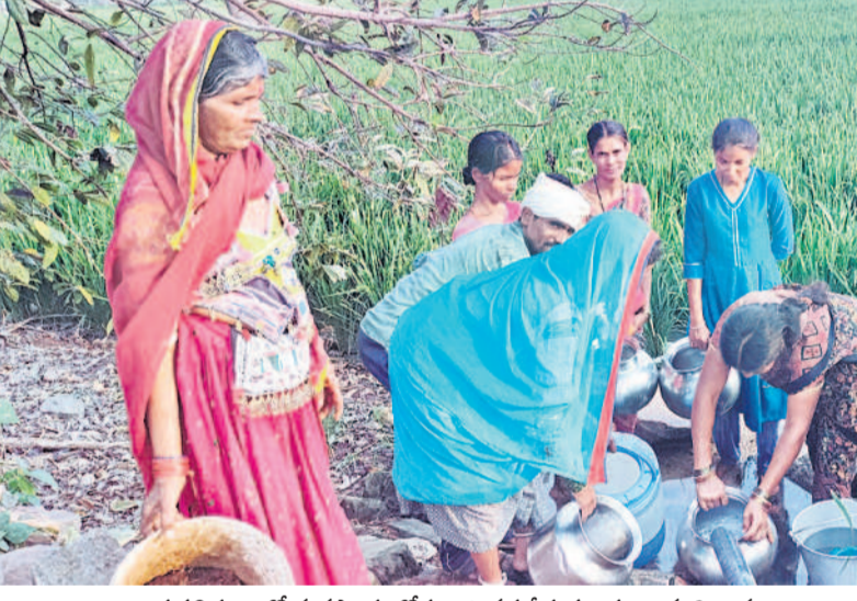
నాచుపత్తి తండాలో వ్యవసాయ బోధనా బిందోబాని వద్ద నీళ్ల పట్టుకుంటున్న గిరిజనులు