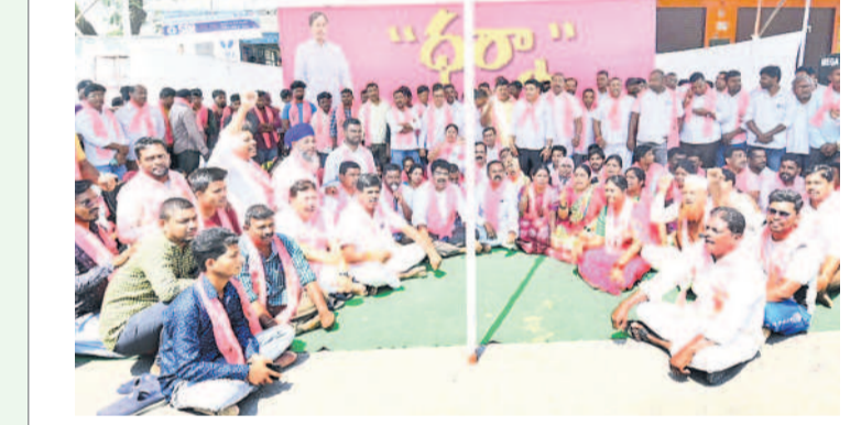
నిజామాబాద్ ధర్షణ కేసు వద్ద నిరసన తెలుపుతున్న బీఆర్ఎస్ నాయకులు