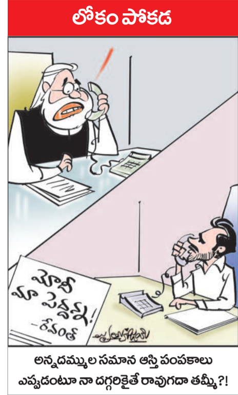
అసెంబ్లీలను సమాన ఆస్తి పంచకాలు ఎవ్వరంటూ నా దగ్గరకెళ్లే రావుగారి తమ్మి?!

బీఆర్ఎస్-బీఎస్పీ పోటీ చేసే స్థానంపై త్వరలోనే విధివిధానాలు, కార్యాచరణ ప్రకటిస్తామని తెలిపారు. దేశంలో విచ్ఛిన్నత ఎజెండాను అమలు చేస్తున్న బీజేపీని అడ్డుకోవడంలో కాంగ్రెస్ పూర్తిగా విఫలమైందని దుయ్యబట్టారు.