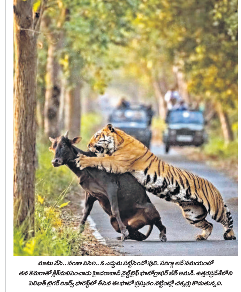
మాటా వేసి.. పంజా విసిరి.. ఓ ఎద్దును పట్టినందులో పులి, సరిగ్గా అడ సమయంలో తన తెమెరాతో కిక్కిరించుకుంటూ హైదరాబాద్ వైట్ ఫెస్ ఫోటోగ్రాఫర్ జి.ఎ.ఎ. ఉత్తరప్రదేశ్ లోని వివిధ టైగర్ రిజర్వ్ ఫోటోగ్రాఫర్ తీసిన ఈ ఫోటో ప్రస్తుతం నెట్లో టాప్ చర్చకు దారితీసింది.