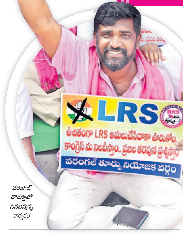
వరంగల్ వారసాలో నినదించుతున్న కార్యకర్త