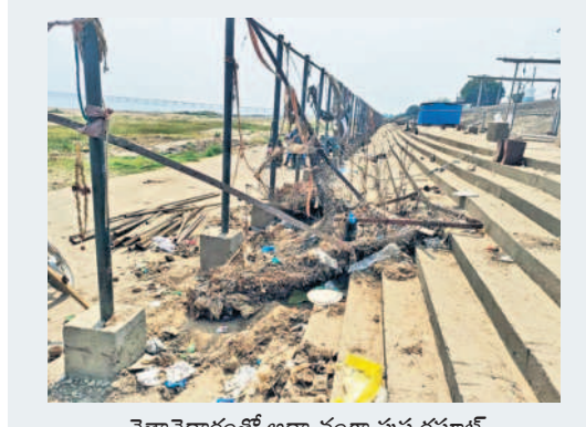
చెత్తాచెదారంలో అధ్యాసంగా పుష్కరపూజ