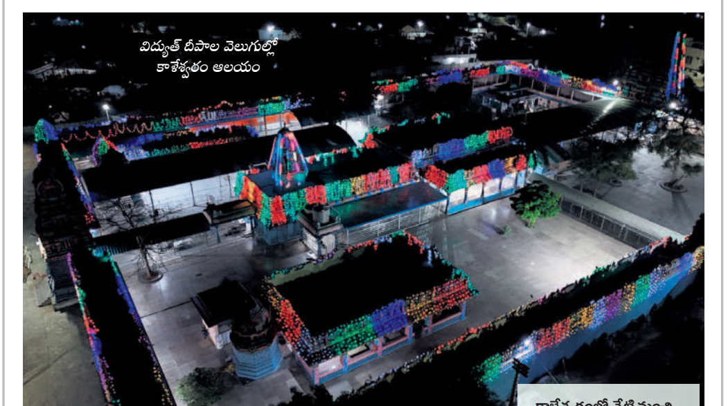
కాశీబుగ్గలో నేటి నుంచి 9వ రోజు శివరాత్రి ఉత్సవాలు 8న స్వామి వారి కల్యాణం