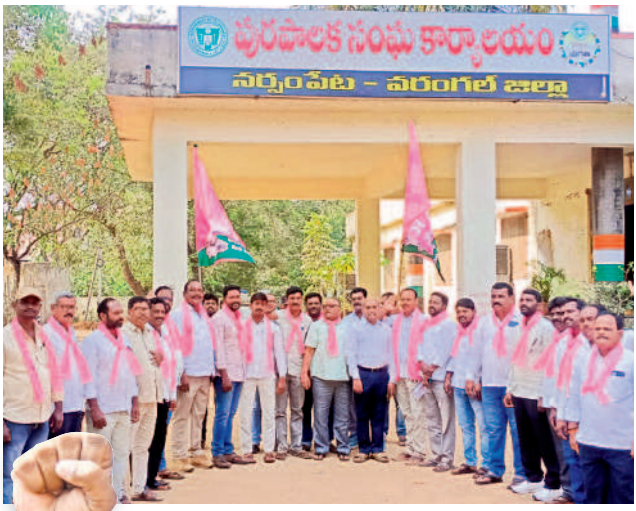
నర్సంపేట మున్సిపల్ కార్పొరేషన్ ఎదుట ధర్నా చేస్తున్న బీఆర్ఎస్ నాయకులు