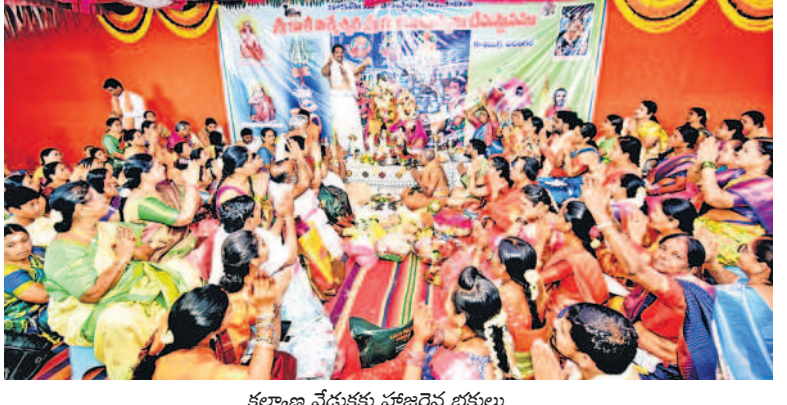
కల్యాణ వేడుకకు హాజరైన భక్తులు