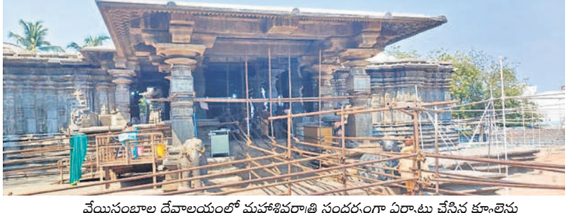
వేయిస్తంభాల దేవాలయంలో మహాశివరాత్రి సందర్భంగా ఏర్పాటు చేసిన క్యూలైన్లు

హనుమకొండ వారసా, మార్చి 6 : శివరాత్రి పండుగను పురస్కరించుకుని హనుమకొండ నుంచి రామప్పకు ప్రత్యేక బస్సులు ప్రతి అరగంటకు నడుపుతున్నట్లు ప్రధానమంత్రి-2 డిప్యూటీ సీనియర్ అధికారులు హనుమకొండ నుంచి రామప్పకు ఎక్స్ ప్రెస్ (పెద్దలకు రూ.100, పిల్లలకు రూ.60) పల్లెటెలుగు(రూ.80, రూ.40) ములుగు నుంచి రామప్పకు ఎక్స్ ప్రెస్(రూ.40, రూ.30) పల్లెటెలుగు(రూ.30, రూ.20) ఉంటుందని, ఈ అవకాశాన్ని భక్తులు సద్వినియోగం చేసుకోవాలని కోరారు.