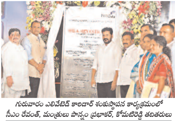
గురువారం ఎలివేటిడ్ కారిడార్ శంకుస్థాపన కార్యక్రమంలో సీఎం రేవంత్, మంత్రులు పొన్నం ప్రభాకర్, కోమటిరెడ్డి తదితరులు

నీళ్ళు లేక స్కూళ్ళు మూత! బెంగళూరులో నీటి కటకట ప్రైవేటు ట్యాంకర్ రేట్లు డబ్బల్ కాంగ్రెస్ పాలనలో కర్ణాటక ప్రజల అప్లక్షణాలు ఆందోళనలకు విపక్షం పిలుపు >7