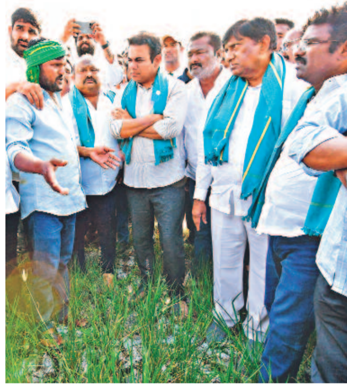
నెరైలు బాలన తన పాలాన్ని బీఆర్ఎస్ నేతలు కేటీఆర్, వినోద్, గంగుల కమలాకర్, రసమయి, కౌశిక్రెడ్డికి చూపుతున్న కరీంనగర్ జిల్లా ఇరుకుల్ల రైతు ఎర్ర శ్రీనివాస్

కండ్లముందే పాలం పరైలు వారింది.. సర్కారుకు పట్టంపేలేదు