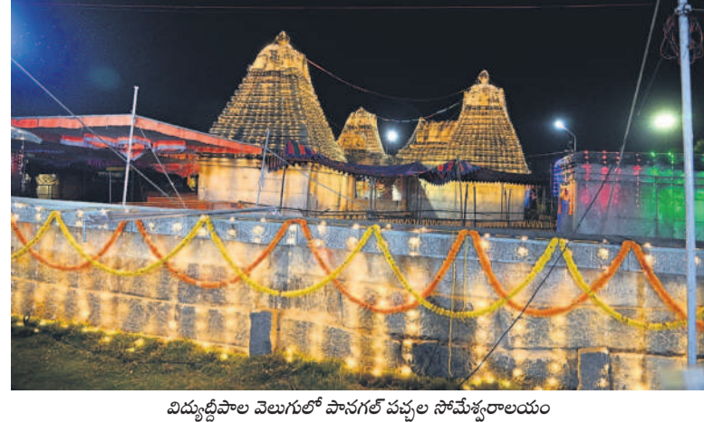
విద్యుద్దీపాల వెలుగులో పానగల్ వద్దల సోమేశ్వరాలయం