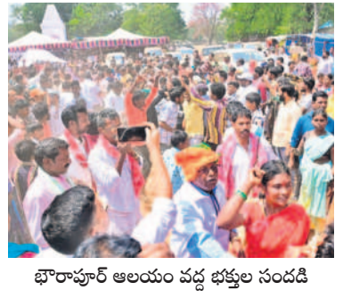
భౌరాపూర్ అలయం వద్ద భక్తుల సందడి