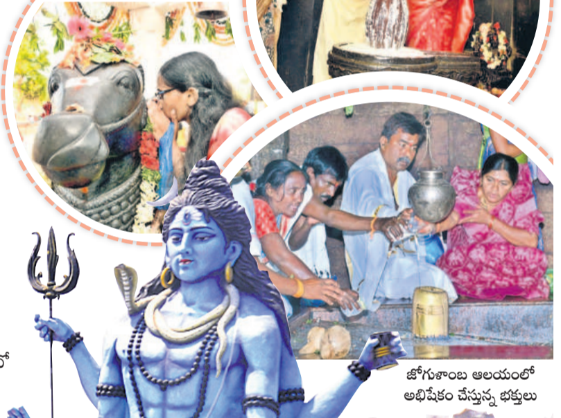
జోగులంబ అలయంలో అభిషేకం చేస్తున్న భక్తులు