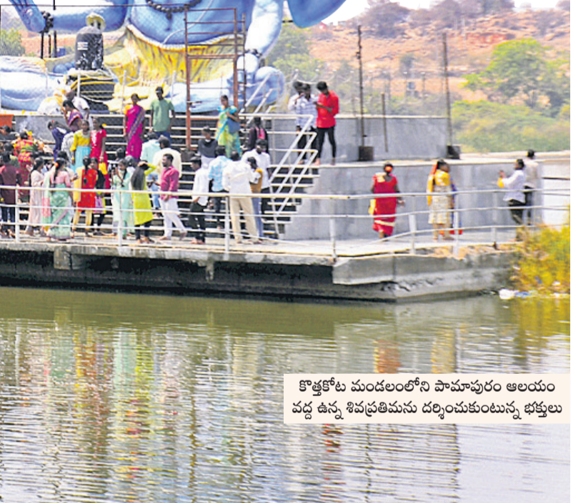
కొత్తకోట మండలంలోని పామాపురం అలయం వద్ద ఉన్న శివప్రతిమను దర్శించుకుంటున్న భక్తులు