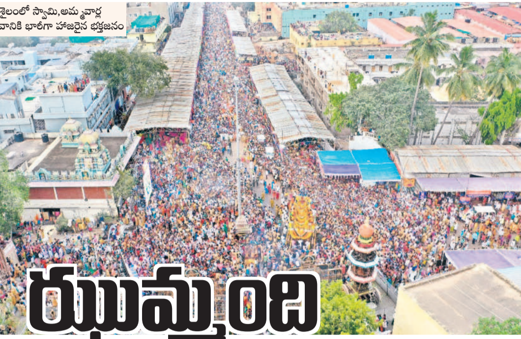
శ్రీశైలంలో స్వామి, అమ్మవార్ల ప్రభోత్వవానికి భారీగా హాజరైన భక్తజనం