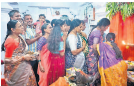
నారాయణపేట జిల్లా కేంద్రంలోని శివాలయంలో పూజలు చేస్తున్న భక్తులు