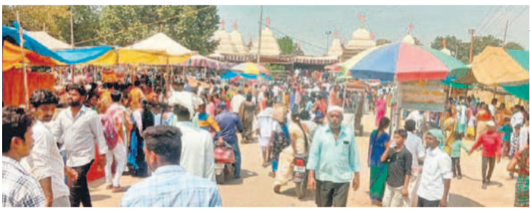
లలితాసోమేశ్వరస్వామి అలయ ప్రాంగణంలో భక్తుల రద్దీ