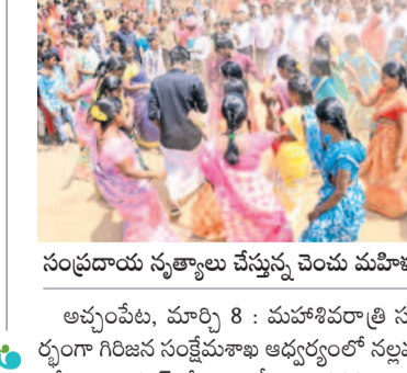
సంప్రదాయ నృత్యాలు చేస్తున్న చెంచు మహిళలు