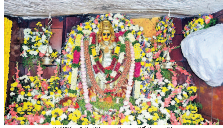
మహాశివరాత్రి సందర్భంగా అమ్మవారి ప్రత్యేక అలంకరణ