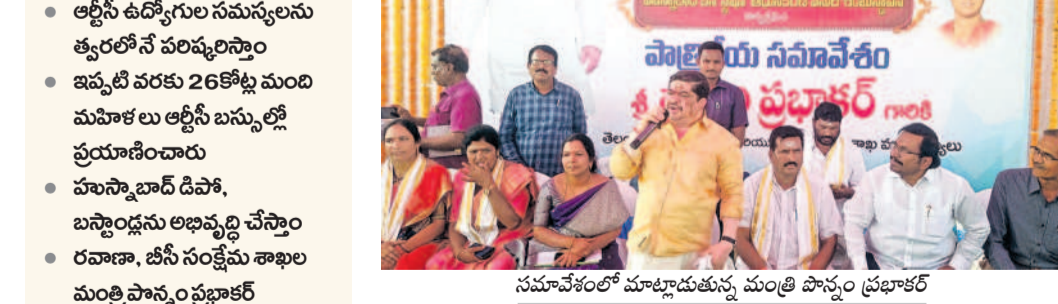
సమావేశంలో మాట్లాడుతున్న మంత్రి పాపయ్య ప్రభాకర్