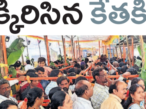
దర్శనం కోసం క్యూలో నిల్చున్న భక్తులు