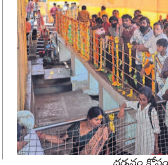
దర్శనం కోసం క్యూలో వేచి ఉన్న భక్తులు