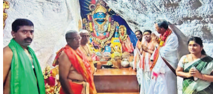
కొమురెల్లి మల్లన్న నన్నిదిలో ఎమ్మెల్యే పల్లె రాజేశ్వర్ రెడ్డి