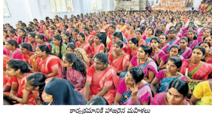
కార్యక్రమానికి హాజరైన మహిళలు

మందికి ఉచితంగా కుట్టుమిషన్ల ఇవ్వడం తెలిపారు. ఉచిత కుట్టుమిషన్ల ఇవ్వడంతో 10వేల రూపాయల విలువ కుట్టుమిషన్ల ఉచితంగా ఇస్తున్నట్లు తెలిపారు. మహిళాభివృద్ధి బీఆర్ఎస్ ప్రభుత్వం ఎన్నో మంచి కార్యక్రమాలు అమలు చేసినట్లు గుర్తించారు. ఎన్నికలు ఉన్నా లేకున్నా, రాజకీయాలతో సంబంధం లేకుండా మీ కుటుంబ సభ్యుడిగా మీకోసం పనిచేస్తున్నా, కంపెనీల వద్ద ఉద్భవించిన కుట్టుమిషన్ల తెచ్చి పంపిణీ చేస్తున్నట్లు హరీశ్ రావు తెలిపారు. తనప్రేమ మీ ప్రేమ ఆశీర్వాదం ఎప్పటికీ ఇలాగే ఉండాలన్నారు. ఎన్టీ రోడ్ వీధి వద్ద ఉన్న కోసం డిగ్రీ గురుకుల కాలేజీను ప్రారంభించానని తెలిపారు. సిద్దిపేటలో మహిళల కోసం అనేక కార్యక్రమాలు అమలు చేసినట్లు తెలిపారు. తన శక్తిమేర సిద్దిపేట అభివృద్ధికి అన్నివిధాలా కృషిచేసినట్లు తెలిపారు.