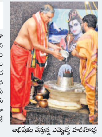
అభిషేకం చేస్తున్న ఎమ్మెల్యే హరీశ్ రావు