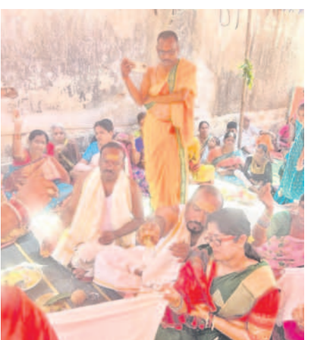
ఎల్లారెడ్డిలోని శ్రీ రాజరాజేశ్వర స్వామి ఆలయంలో నిర్వహించిన కల్యాణంలో పాల్గొన్న భక్తులు