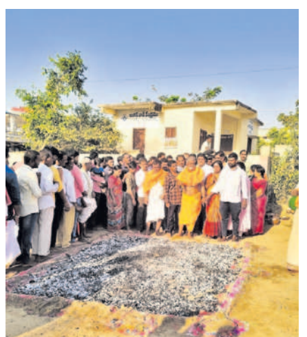
ఎల్లారెడ్డి నీలకంఠేశ్వరాలయం వద్ద అగ్ని గుండాల నిర్వహిస్తున్న ఆలయ పూజారులు