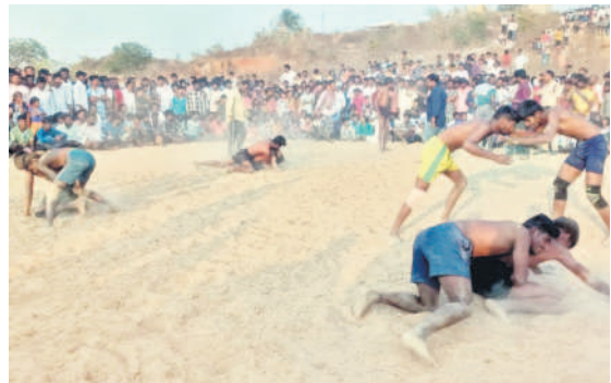
నరసరావుపేట మండలం మైలారం గ్రామంలో నిర్వహించిన కుస్తీపోటీల్లో తలవంచుతున్న మల్లయోధులు