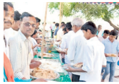
మద్దులలోని సోమలింగేశ్వరాలయంలో నిర్వహించిన అన్నదానంలో పాల్గొన్న భక్తులు