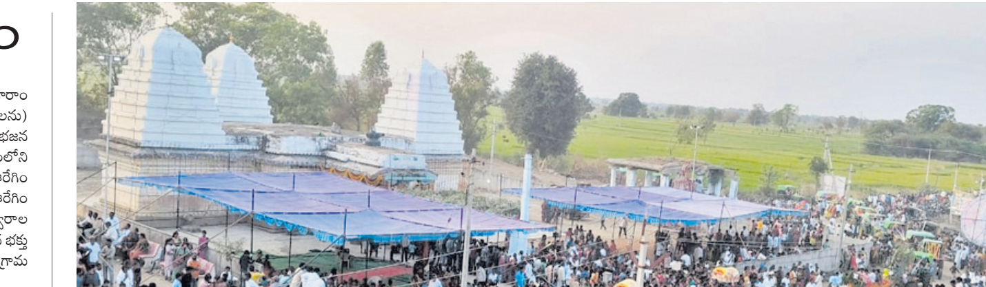
నిజాంసాగర్, మార్చి 9: మహావేంకటేశ్వర ఆలయంలో శివరాత్రి ఉత్సవాలకు సంబంధించి భక్తులు పెద్ద సంఖ్యలో తరలిరావడంతో ఆలయ పరిసరాల కిక్కిరిసిపోయాయి. - ఎల్లారెడ్డి, మార్చి 9

గాంధారి, మార్చి 9: భక్త తుకారాం రచించిన గాథలను మండల కేంద్రంలో శనివారం ప్రధాన వీధుల్లో ఊరేగించారు. మహాశివరాత్రి పర్యవసానం పురస్కరించుకొని మండల కేంద్రంలోని భోగేశ్వరాలయంలో వారం రోజుల నుంచి సప్తాహం, భజన కార్యక్రమాలను నిర్వహించారు. శనివారం సప్తాహం ముగింపును పురస్కరించుకొని అందంగా రచించిన గాథలను (అభంగాలను) ఉంచి భోగేశ్వరాలయం నుంచి భజన చేస్తూ పాటలు పాడుతూ గ్రామంలోని ప్రధాన వీధుల మీదుగా ఊరేగించారు. మహిళల కలకాలతో ఊరేగింపులో పాల్గొన్నారు. భోగేశ్వరాలయంలో సప్తాహం నిర్వహించిన భక్తులకు ఆలయ కమిటీ సభ్యులు, గ్రామ స్థులు కృతజ్ఞతలు తెలిపారు.