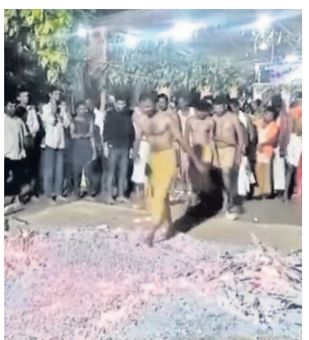
విట్లం రాజన్న ఆలయం వద్ద అగ్ని గుండలలో నడుస్తున్న భక్తులు