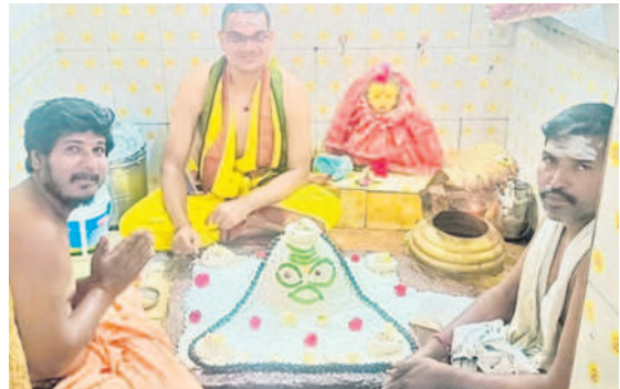
విట్లం రామేశ్వరాలయంలో అన్నపూజ నిర్వహిస్తున్న భక్తులు