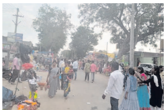
దోమకొండలోని శివరాం మందిరం సమీపంలో వెలిసిన జాతర