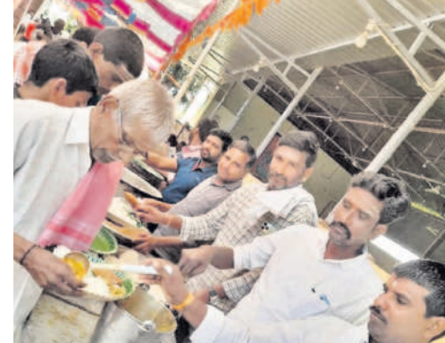
రావేళ్లూరాలయంలో నిర్వహించిన అన్నదానంలో పాల్గొన్న భక్తులు