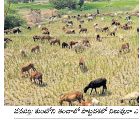
వనపర్తి: కుంట్ల తండాలో పొట్లదళలో నిలుపునా ఎండిపోయి గొర్రెలకు మేతగా మాలిన వరిపంట

కరెంటీయరు కనికరించకపోయే ఇది గొట్టపల్లి రైతుల కోసం నెవ్వెల, మార్చి 9 : '100 కిమీ ట్రాన్స్ఫార్మర్ నుంచి ఆయిల్ లీకవుతుందని, లో బోల్డీ సమస్య ఉందని నెల కిందే ఏకాకి చెప్పినం. బోర్డు కాలిపోతున్నాయి... నీళ్లు లేక పంటలు ఎండిపోతున్నాయి.. ఎంత మొరపెట్టుకున్నా కరెంటీయరు కనికరించకపోయే' అని మందిరాల జిల్లా నెవ్వెల మండలం గొట్టపల్లికి చెందిన రైతులు శనివారం నెలైరు బానిస పంట పోలీసులకు మామిడి ఆవేదన వ్యక్తం చేశారు. ఊరిలోని 100 కిమీ ట్రాన్స్ఫార్మర్ పరిధిలో 80 ఎకరాలకు పైగా పరిసరాన్ని కరెంటీయరు నిర్వహణలో పంటల పీతి కండ్లకుండా పోయే పరిస్థితి దాపురించింది తమ గోడను వెల్లడవుతున్నారని. ఈ విషయం ఏక మల్లయ్యను వివరణ కోరగా, రైతులంతా ఒకటిపాటి మోటుర్లు సార్వే చేయడం వల్ల డిజీఆర్ మీద ఓవర్లోడి పడుతుంది, నాతో ఫిజిలు ఆగడంలేదని, రైతులు సమస్యను తెలుసుకుని వినియోగించుకోవాలని అన్నారు.