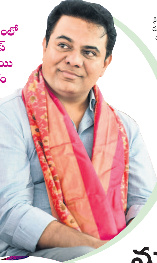
జిల్లా కేంద్రంలో బీఆర్ఎస్ విస్తృతస్థాయి సమావేశం

ఓటమిపై సమీక్ష.. కాంగ్రెస్ పార్టీ అధికారం చేపట్టినప్పటికీ బాధ్యతలను విస్మరించి ప్రవర్తిస్తోంది. సీఎం సీట్లో కూర్చున్న వ్యక్తి కూడా దుర్భాషలాడడం, ప్రభుత్వ వేదికలను రాజకీయ వేదికలుగా మార్చడం, ప్రజాస్వామ్య సూక్ష్మ విరుద్ధంగా వ్యవహరిస్తున్న తీరుపై కేటీఆర్ వాగ్విణ్ణాలు సందించుతున్నారు. సోషల్ మీడియాను బలంగా వాడుకోవడంతోపాటు అధికార పార్టీ తీరును ఎండగట్టే వ్యూహాలను వివరించనున్నారు. ఉమ్మడి నిజామాబాద్ జిల్లా గులాబీ పార్టీకి రెండు దశాబ్దాలుగా కంఠకోటగా ఉంది. ఉద్యమ కాలం నుంచి స్వరాష్ట్రంలోనూ ప్రజలు కేటీఆర్ కు జై కొట్టారు. అసామాన్యంగా మొన్నటి అసెంబ్లీ ఎన్నికల్లో చరాభవం ఎదురైంది. ఆసెంబ్లీ బద్ద చేశారు. తప్పుడు ప్రచారంతో ప్రజల్లోకి వెళ్లిన కాంగ్రెస్ పార్టీ నేతలంతా జూరాలను నమ్మించారు. ఇప్పుడు అధికారంలోకి వచ్చాక ఇచ్చిన హామీలను నెరవేర్చలేక మాట దాటబెట్టుతున్నారు. గతంలో కేటీఆర్ ప్రభుత్వం చెప్పిన మాటలను చెప్పినట్లుగా అమలుచేసి చూపించింది. అంతేకాకుండా మ్యూజిఫికేషన్లో పేర్కొన్న హామీలను సైతం అమలుచేసింది. గడప గడపకా కేటీఆర్ పథకాలను తీసుకువెళ్లింది. కామారెడ్డిని జిల్లాగా మార్చడం, పట్టణ అభివృద్ధి, వైద్య కళాశాల మంజూరుతో అనేక అభివృద్ధి కార్యక్రమాలను అమలు చేసినప్పటికీ ఫలితాలు తారుమారయ్యాయి. ఈ పరిణామాలపై కేటీఆర్ సమీక్షించి, పార్టీ కార్యకర్తలు, ముఖ్యనాయకులతోనూ భేటీ కానున్నారు. ఓటమి గల కారణాలను విశ్లేషించడంతోపాటు భవిష్యత్తులో అనుసరించాల్సిన