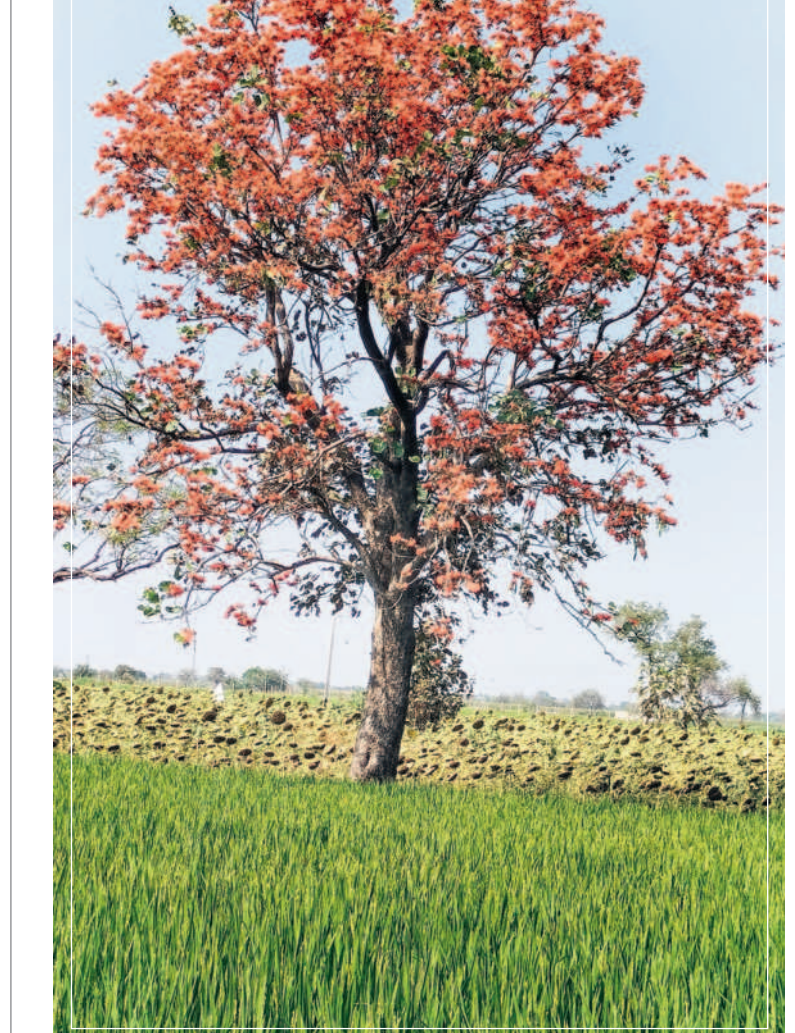
విరగబూసిన మోదుగు పూలు

ఉమ్మడి కోటిగిరి మండలంలోని ఎత్తొండ సమీపంలో ప్రధాన రహదారికి పక్కన పంట పొలాల్లో ఎర్రటి పుష్పాలతో మోదుగు పూలు చెట్లు అందరినీ ఆకట్టుకుంటున్నది. ఈ నెలలో జరుపుకోనున్న హోలీ పండుగ నాడు రంగులదాదానికీ సిద్ధమైంది. మోదుగు చెట్లు ఈ చెట్లు పూలు మరిగిస్తే ఎలాంటి రసాయనాలు అవసరం లేకుండా చక్కటి రంగు తయారవుతుంది. వేసవిలో అడుగు పెడుతున్న వేళ.. ఆకులన్నీ రాలిపోయి.. ఎర్రటి పూలతో మోదుగు చెట్లు ఆకట్టుకుంటున్న దృశ్యం కోటిగిరి మండలం ఎత్తొండ- వల్లభాపూర్ మధ్య శివారు పొలాల్లో కనిపించగా నమస్తే తెలంగాణ లిక్ మనిషివెందింది. -కోటిగిరి, మార్చి 9