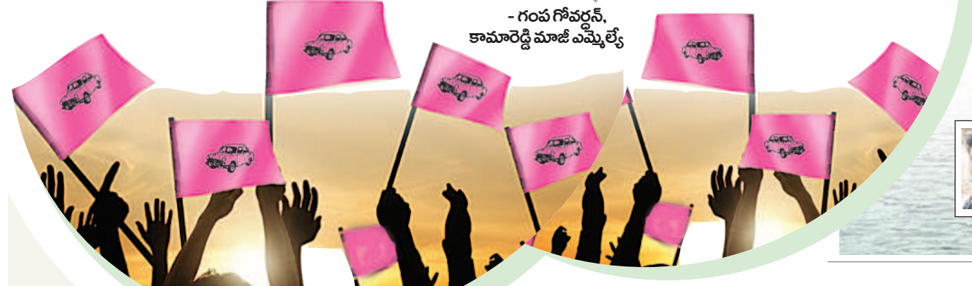
- గంప గోపన్న, కామారెడ్డి మాజీ ఎమ్మెల్యే