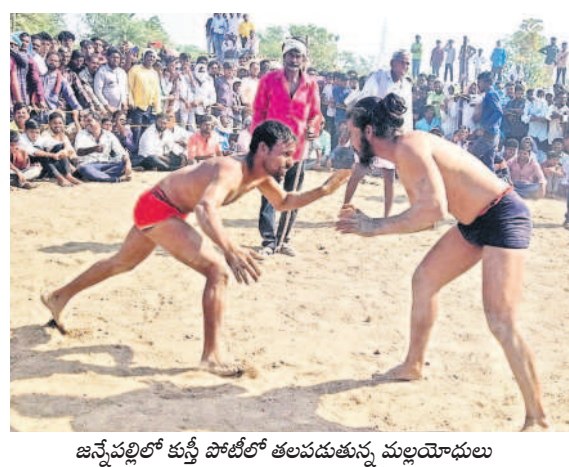
జిన్నపల్లిలో కస్తీ పోటీలో తలవదుతున్న మల్లయోధులు