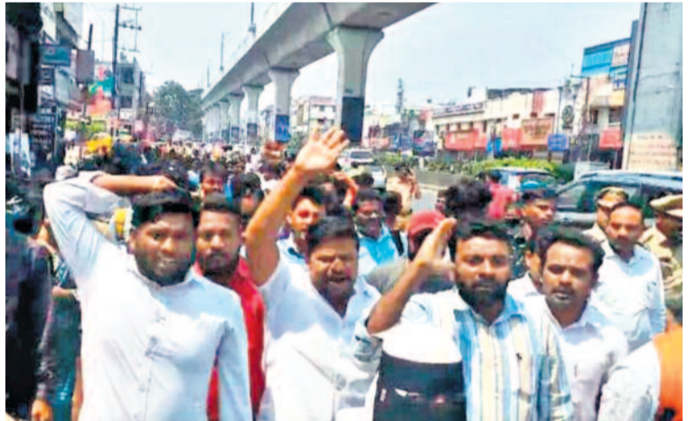
ఇందిరా పార్కు వద్ద ధర్నా చేసేందుకు ర్యాలీగా వెళ్తున్న నిరుద్యోగులు

పీడీ పోస్టులతోపాటు లైబ్రేరియన్ పోస్టుల్లోనూ అనర్హులకు చోటు జూనియర్ లెక్కర (బోటనీ)లోనూ నోటిఫికేషన్ కు విరుద్ధంగా.. ఒక్కో క్యాటగిరీపై ఆరోపణలు వెల్లువ.. ఆందోళనలో అభ్యర్థులు అన్యాయంపై వరుసగా కోర్టు మెట్లు ఎక్కుతున్న నిరుద్యోగులు ఎన్నికల్లో లబ్ధికోసం హడావుడిగా నియామక పత్రాల పంపిణీ అక్రమాల బయటపడుతున్నా నోరువిప్పని కాంగ్రెస్ సర్కార్