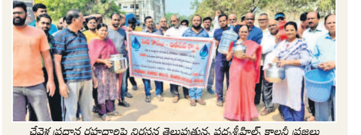
చేపట్టే ప్రధాన రహదారిపై నిరసన తెలుపుతున్న పద్మశ్రీకొల్లె కాలనీ ప్రజలు

మంచినీళ్లు అందించాలని వారు విజ్ఞప్తి చేశారు. ఈ విషయంపై కార్పొరేటర్ పద్మా పతిపాపయ్యాయాడమ్ మాట్లాడుతూ పద్మశ్రీ కాలనీలో 10 లక్షల లీటర్ల నీరు సమర్పించి గల రిజర్వాయరును నిర్మించేందుకు ఏర్పాట్లు చేశామని చెప్పారు. అయితే జనరల్ మేనేజర్ రవీందర్ రెడ్డి బదిలీ కావడంతో రిజర్వాయర్ పనులు ప్రారంభోత్సవానికి నోచుకోలేదని చెప్పారు. జలమండలి అధికారులతో చర్చించి మంచినీళ్లు అందించేందుకు తగిన చర్యలు తీసుకుంటామని తెలిపారు.