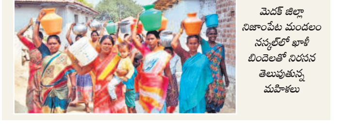
మెదక్ జిల్లా నిజాంపేట మండలం నన్నలలో ఖాళీ బిందెలతో నిరసన తెలుపుతున్న మహిళలు

సర్కారుల పడవీ కాండ్లను వరకు ఎలాంటి నీటి సమస్య లేదని, ప్రత్యేకాధికారుల పాలన ప్రారంభమైన కొద్ది రోజుల్లోనే నీటి సమస్య ఏర్పడిందని కాలనీవాసులు ఆరోపిస్తున్నారు. ఈ మేరకు మహిళలు ఆదివారం ఖాళీ బిందెలతో నిరసన తెలిపారు.