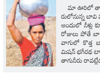
అందరం కలిసి బావి తవ్వకుంటున్నం

తప్ప మరే పనిచేయడం లేదు. అధికారులు ఇప్పటికైనా స్పందించి కేసీఆర్ సర్కారు ఏర్పాటు చేసిన మిషన్ భగీరథ ట్యాంకులకు మరమ్మత్తులు చేపట్టి తాగునీరు సరఫరా చేయాలని వారు కోరుతున్నారు.