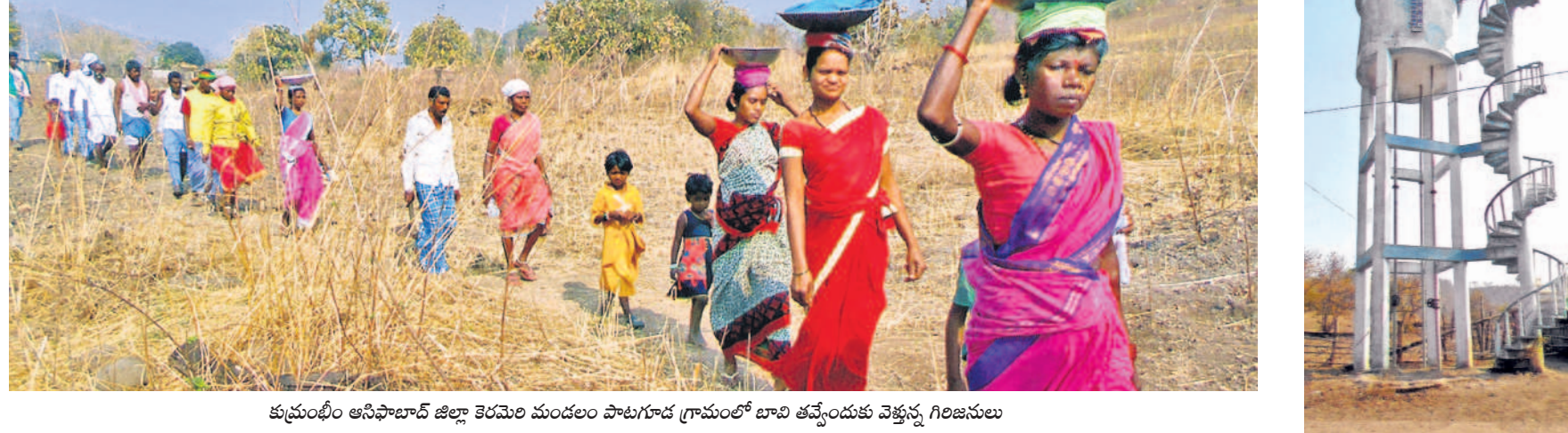
కుప్రంబీం ఆసిఫాబాద్ జిల్లా కెరమెల మండలం పాటగూడ గ్రామంలో బావి తవ్వించుకు వెళ్తున్న గిరిజనులు

కేసీఆర్ సర్కారులో ఇంటింటికీ 'భగీరథ' నీరు • అధికారుల నిర్లక్ష్యంతో మూడు నెలలుగా అందని నీళ్లు