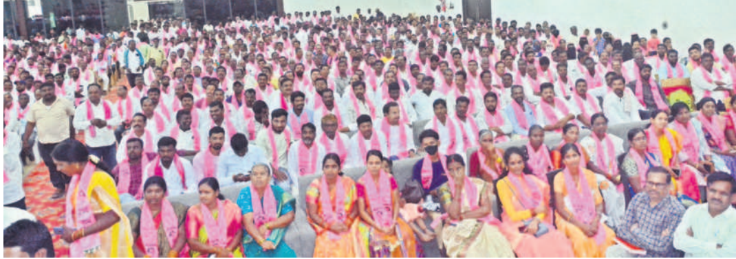
సమావేశంలో పాల్గొన్న కామారెడ్డి నియోజకవర్గ బీఆర్ఎస్ నాయకులు, కార్యకర్తలు

వేసి చూపించాలని కేటీఆర్ అన్నారు. ప్రస్తుతం తెలంగాణలో తాండవిస్తున్న కరువు కాలం తెచ్చింది కాదన్నారు. కాంగ్రెస్ తెచ్చిన కరువుగా అభివృద్ధి కాదన్నారు. రోజుకు 2 టీఎంసీలు నీళ్లు కాశీ శృంగం మేడిగడ్డ వద్ద ఎత్తిపోసి వీలున్నప్పటికీ ద్రస్ నేతృత్వంలోనే పార్లమెంట్ ఎన్నికలకు వెళ్లి మంటూ వేర్పాటున్నారు.