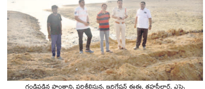
గండిపడిన ప్రాంతాన్ని పరిశీలిస్తున్న ఇరిగేషన్ ఈఈ, తహసీల్దార్, ఎమ్మె