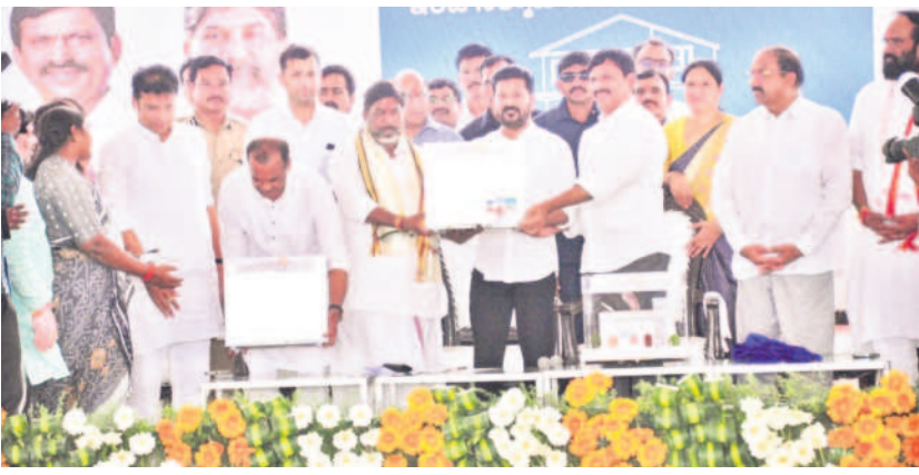
భద్రాచలంలో ఇందిరమ్మ ఇళ్ల నమూనాను అభివృద్ధిస్తున్న సీఎం రేపంత్ రెడ్డి, డిప్యూటీ సీఎం భట్టి, మంత్రులు