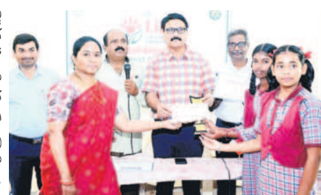
ప్రథమ బహుమతిని అందజేస్తున్న డిఈవో