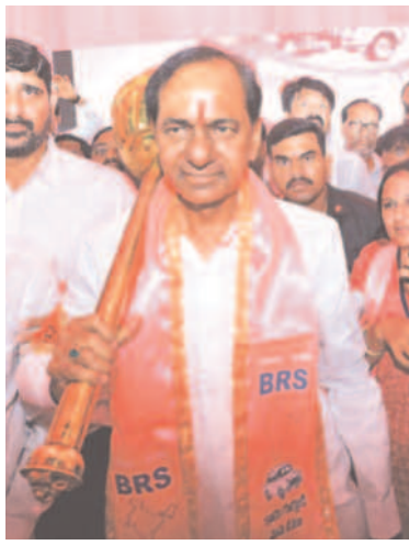
తెలంగాణ అనే మాటే అసెంబ్లీలో వినిపించడం కూడనే రోజుల్లో కరీంనగర్ గడ్డ నాకు అందగా నిలబడింది. నాకున్న పదవులను విసిరి వ్యాఘ్రాన కొట్టిన. నిలబడాలి. కలబడాలి. సొంత రాష్ట్రాన్ని సాధించాలని నాతో పాటు పిడికెడు మనుషులతో ఇక్కడికి వచ్చి జై తెలంగాణ అని నినదించిన. - అధినేత కేసీఆర్