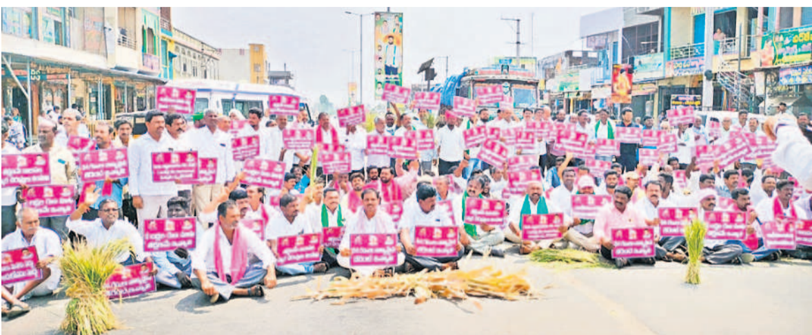
దేవరప్పల : ఎండిన వరి, మక్కజొన్న కంకలతో సూర్యాపేట-జనగామ హైవేపై నిరసన తెలుపుతున్న రైతులు, బీఆర్ఎస్ శ్రేణులు