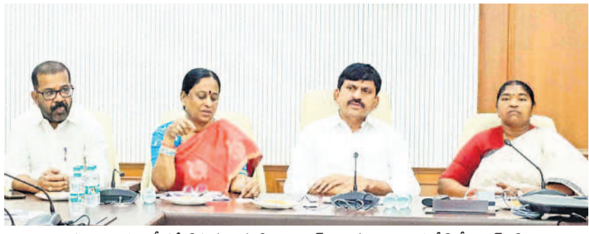
సచివాలయంలో సమీక్షిస్తున్న ఉమ్మడి జిల్లా ఇన్‌చార్జ్ మంత్రి పొంగులేటి శ్రీనివాసరెడ్డి, మంత్రులు కొండా సురేఖ, సీతక్క, ఎమ్మెల్యే నాయిని రాజేందర్రెడ్డి