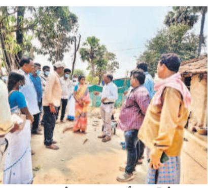
గుమ్మడిదొడ్డి గ్రామస్థలలో మాట్లాడుతున్న డీఎంహెచ్‌వో అప్పయ్య

వైరల్ అర్థదెబ్బిన వల్లే మోకాళ్ల నొప్పులు : డీఎంహెచ్‌వో అప్పయ్య