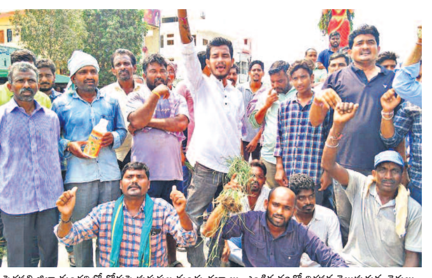
పెద్దపల్లి జిల్లా మండలంలో రోడ్డుపై పురుగుల మందు డబ్బాలు, ఎండిన వరితో నిరసన తెలుపుతున్న రైతులు

హైదరాబాద్, మార్చి 14 (నమస్తే తెలంగాణ): పనులు చేసిన కాంగ్రెస్ కార్యకర్తల బిల్లులు చెల్లించని ప్రభుత్వం.. ఉచితాలను ధారాదత్తం చేయడానికి వెనుకాడటం లేదని హైకోర్టు వ్యాఖ్యానించింది. పనులు చేసిన కాంగ్రెస్ కార్యకర్తల బిల్లులు చెల్లించమని ఉచిత పథకాల పేరుతో మాత్రం చూడకూడదు అంటే సీసార్లను ఆక్షేపించింది. బిల్లులు చెల్లించాలని తాము జారీచేసిన ఆదేశాలను అధికారులు పట్టించుకోవోవ దాన్ని తీవ్రంగా పగిలేసింది. ఆ ఉత్తర్వులను ఎలా అమలుచేయించారో తమకు తెలుసునని వ్యాఖ్యానించింది. కల్వకుర్తి ఎత్తితల పథకం పనులకు సంబంధించి రూ.28.97 కోట్లు, శ్రీపాదసాగర్ పనులకు సంబంధించి రూ.76.53 కోట్లు చొప్పున బకాయిలు చెల్లించాలంటూ గత డిసెంబర్ లో జారీచేసిన ఆదేశాలను అమలుచేయకపోవడంపై ఆగ్రహం వ్యక్తం చేసింది. శ్రీపాదసాగర్ పనులు చేసిన బిల్లులు చెల్లించకపోవడంతో నవయుగ-ఐఆర్, సీఎల్-ఎన్ఈడబ్ల్యూతో కూడిన సంయుక్త భాగస్వామ్య సంస్థ గతంలో హైకోర్టులో పిటిషన్ దాఖలు చేసింది. దీనిని విచారించిన కోర్టు.. ఆ బిల్లులను పది రోజుల్లోగా చెల్లించాలని గత డిసెంబర్ లో ఆదేశించింది. ఆ ఆదేశాలు అమలుకావడంతో ఆ సంస్థ కోర్టు దిక్కరణ పిటిషన్ దాఖలు చేసింది. దీనిపై జస్టిస్ బి విజయ్ సేన్ రెడ్డి గురువారం విచారణ జరిపారు. ఈ సందర్భంగా బిల్లులు చెల్లించేందుకు ఏడు డశల్లో క్రియేట్ చేసిన రావాల్సి ఉంటుంది, మరో మూడు నెలల గడువు కావాలని ప్రభుత్వ ప్రత్యేక న్యాయవాది రాహుల్ రెడ్డి కోరారు. దీనిపై స్పందించిన హైకోర్టు.. కోర్టు దిక్కరణ కేసులో నోటిసులు జారీచేసి >10వ పేజీలో