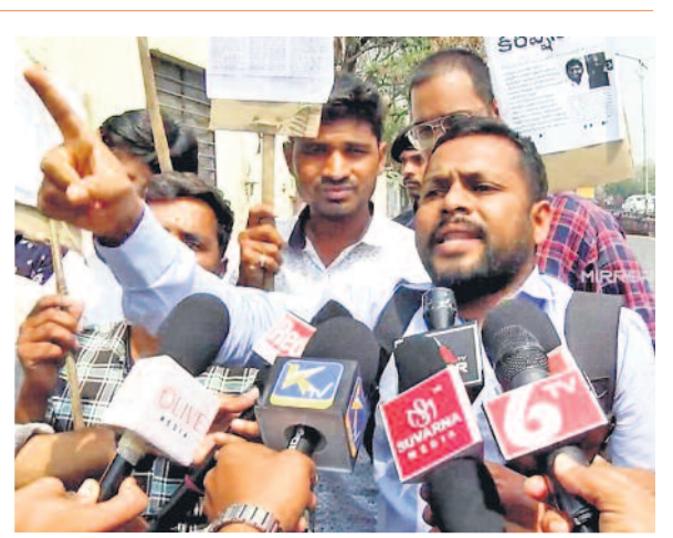
డెమో మార్చులు కేటాయింపులో అక్రమాలు జరిగాయని ఆరోపిస్తూ ప్రజాభవన్ వద్ద జరిగిన ఆందోళనలో మాట్లాడుతున్న అభ్యర్థి

ట్రీట్ వ్యవహారమే ఆరోపణలకు ఊతం ట్రీట్ వ్యవహారంపై తీవ్ర అనేక అనుమానాలకు తావిస్తున్నది. టీజీటీ, పీజీటీ, పీడీ తదితర పోస్టుల విషయంలో సర్టిఫికేట్ వెలికితేషన్ పూర్తయిన మరుసటిరోజే ఆయా పోస్టులకు ఎంపికైన 1౭2 అభ్యర్థుల జాబితాను ట్రీట్ ప్రకటించింది. కానీ జేఎల్, డీఎల్ పోస్టులకు సంబంధించిన జాబితాను సర్టిఫికేట్ వెలికితేషన్, డెమోలను తీసుకున్న దాదాపు వారం పది రోజుల అనంతరం ప్రకటించింది. ఈ జాప్యమే పోస్టుల భర్తీలో గోతమాల్ జరిగిందనే ప్రచారానికి ఊతమిస్తున్నది.