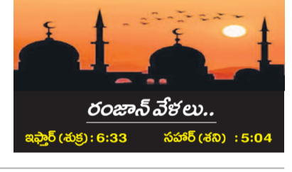
రంజన్ వేళలు.. ఇషార్ (తల్లి) : 6:33 సఫర్ (శని) : 5:04

చేస్తున్నారు. పండించిన పంటలు బాగా కురవడంతో ఇప్పటి వరకు ఏలాంటి ఇబ్బందులు లేకుండా రెండు పంటలు సాగు చేసుకున్న రైతులకు ఈ యేడాది సరైన వర్షాల లేకపోవడంతో సాగునీటికి ఇబ్బందులు పడుతున్నాయి. పొట్లదళలో ఉన్న పంటలను కాపాడుకోలేక రైతులు పశువులను మేతకు వదిలేస్తున్నారు. జడ్డర్ మండలంలో యాసంగిలో దాదాపు రెండువేల ఎకరాల పొలం వరి పంట సాగు చేశారు. గత ఏడాదికంటే 2 వేల ఎకరాలు తక్కువగా వరి నాటడం జరిగింది. అందుకు కారణం జనపరిలోనే బోర్లలో నీళ్లు తగ్గడంతో రైతులు సాగును తగ్గించారు. కానీ భూగర్భ జలాలు రోజూరోజూ తగ్గుతుండడంతో బోర్లు నీళ్లు పోయడం లేదు. కొంతమంది రైతులకు చెందిన వరి పంటలు పూర్తిగా ఎండిపోతుంటే.. మరికొంతమంది రైతులది ఆరు తడిలా నీటిని ఇస్తున్నారు. ఇక నెలరోజులైతే వరి పంటలు కూడా ఎండిపోయే పరిస్థితి నెలకొంది. ఎండిన పంటలైనా గుర్తించి ప్రభుత్వం రైతులకు నష్టపరిహారం చెల్లించాలని వేడుకుంటున్నారు.