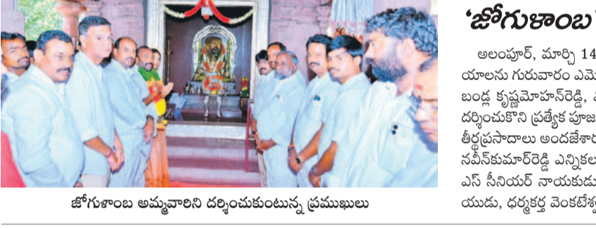
జోగుళాంబ అమ్మవారిని దర్శించుకుంటున్న ప్రముఖులు