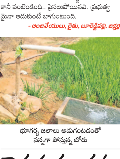
భూగర్భ జలాలు అడుగంటడంతో సన్నగా పోస్తున్న బోరు