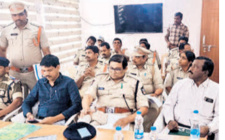
భద్రతా అంశాలపై చర్చిస్తున్న రెండు రాష్ట్రాల పోలీసు అధికారులు

మామిళ్ళగూడెం, మార్చి 14 : పచ్చే పార్లమెంట్ ఎన్నికల సజావుగా జరిగేందుకు రెండు రాష్ట్రాల సరిహద్దుల వద్ద పటిష్ట భద్రతను ఏర్పాటు చేసేందుకు ప్రణాళికలు సిద్ధం చేసినట్లు తెలియగా, ఆంధ్ర రాష్ట్ర సరిహద్దు జిల్లాల పోలీస్ అధికారులు తెలిపారు. పార్లమెంట్ ఎన్నికల సేవల్లో రాష్ట్ర సరిహద్దు పోలీసుల మధ్య భద్రతా ఏర్పాట్లపై ఏపీ రాష్ట్ర మైలవరం ఏసీపీ కార్యాలయంలో గురువారం సమీక్షా సమావేశం నిర్వహించారు. జిల్లాలోని సరిహద్దు ప్రాంతాల్లో తీసుకోవాల్సిన జాగ్రత్తలు, మద్యం, నగదు నియంత్రణను చేపట్టాల్సిన చర్యలపై చర్చించారు. ప్రధానంగా ఆంధ్రరాష్ట్ర, ఆంధ్ర జిల్లా పోలీస్ ప్రవేశ, నిర్వహణ మార్గాల్లో 24/7 చెక్ పోస్టులను ఏర్పాటు చేసే పకటనగా తనిఖీలు చేపట్టాలా సమన్వయంతో ముందు జిల్లాలనే అధికారులు సూచించారు. నాన్ బెయిలబుల్ వారెంట్ విషయంలో ఇరు జిల్లాలు, రాష్ట్రాల అధికారులు సహకరించు