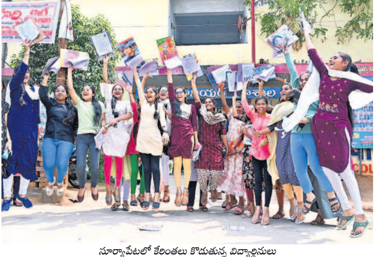
సూర్యాపేటలో కేంద్రాలు కొడుతున్న విద్యార్థినులు