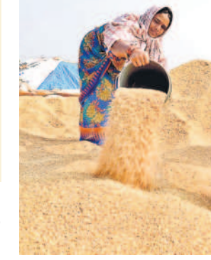
లక్ష్యం చేరడం కష్టం.. యాసంగిలో 3.54 లక్షల మెట్రిక్ టన్నుల ధాన్యం సేకరణలని నిర్ణయించింది. మార్చి చివరి వారంలో కొనుగోలు కేంద్రాలు ప్రారంభించడానికి ఏర్పాటు జరుగుతున్నాయి.

సూర్యాపేట జిల్లాలో 3.54 లక్ష మెట్రిక్ టన్నుల సేకరణ లక్ష్యం 2.81 కొనుగోలు కేంద్రాల ఏర్పాటు ఈ నెల చివరి వారంలో ప్రారంభం సూర్యాపేట, మార్చి 14 : యాసంగి పరిధాన్యం సేకరణకు జిల్లా యంత్రాంగం సన్నద్ధమవుతున్నది. సూర్యాపేట జిల్లా వ్యాప్తంగా 281 కొనుగోలు కేంద్రాలు ఏర్పాటు చేసి 3.54 లక్షల మెట్రిక్ టన్నుల ధాన్యం సేకరణలని నిర్ణయించింది. మార్చి చివరి వారంలో కొనుగోలు కేంద్రాలు ప్రారంభించడానికి ఏర్పాటు జరుగుతున్నాయి.