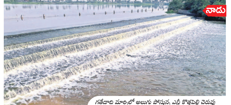
గతేడాది మార్చిలో అలుగు పోస్తున్న ఎన్టీఆర్ కృష్ణాపల్లి చెరువు

నేడు అడుగంటిన కొత్తపల్లి చెరువు వేసవి ప్రారంభంలోనే చెరువులు ఎండిపోతున్నాయి. గతేడాది మార్చి నెలలో నీటిలో కళకళలాడిన శాలిగారం మండలంలోని ఎన్టీఆర్ కృష్ణాపల్లి చెరువు ప్రస్తుతం అడుగంటి పోయింది. భూగర్భ జలాలు అడుగంటి సాగునీటికి ఇప్పుడే ఇబ్బందిగా మారగా రానున్న ఎండలతో పశుపక్షులకు గడ్డ పరిస్థితులు తప్పింపు లావు. —శాలిగారం, మార్చి 14