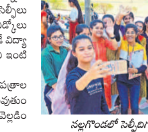
నల్లగొండలో సెల్ఫీదిగుతున్న విద్యార్థినులు