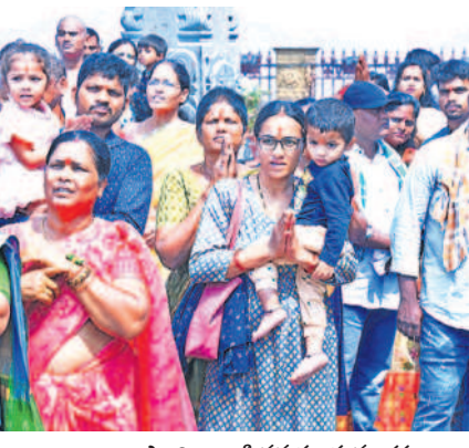
స్వామి వారికి నమస్కరిస్తున్న భక్తులు

నేటి నుంచి రోజుకు 1500 మందికి భోజనం బ్రహ్మోత్సవాలు తిలకించే భక్తులకు దేవస్థానం భోజన వసతి కల్పించనున్నది. ఇప్పటికే కొండకింద లక్ష్మీపుష్పరిణి వెంకట దీక్షాపథుల మండపంలో రోజుకు ఉదయం నుంచి మధ్యాహ్నం వరకు 500 మందికి భోజనాలు ఏర్పాటు చేయగా బ్రహ్మోత్సవాలు సందర్భంగా 1500 మందికి అందించనున్నారు. ఉదయం టిఫిన్, మధ్యాహ్నం భోజనం, రాత్రి భోజనం నేటి నుంచి ఈ నెల 21వరకు భక్తులకు అందుబాటులో ఉండనున్నది.