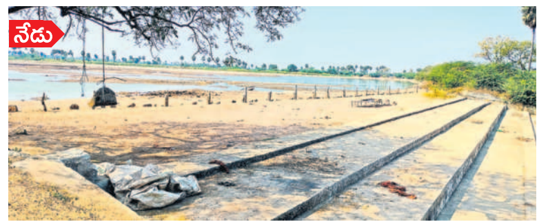
శాలిగారం : ప్రస్తుతం నీళ్ల లేక అడుగంటిన కొత్తపల్లి చెరువు

నేడు అడుగంటిన కొత్తపల్లి చెరువు వేసవి ప్రారంభంలోనే చెరువులు ఎండిపోతున్నాయి. గతేడాది మార్చి నెలలో నీటిలో కళకళలాడిన శాలిగారం మండలంలోని ఎన్టీఆర్ కృష్ణాపల్లి చెరువు ప్రస్తుతం అడుగంటి పోయింది. భూగర్భ జలాలు అడుగంటి సాగునీటికి ఇప్పుడే ఇబ్బందిగా మారగా రానున్న ఎండలతో పశుపక్షులకు గడ్డ పరిస్థితులు తప్పింపు లావు. —శాలిగారం, మార్చి 14