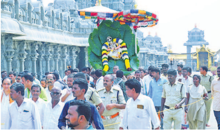
అలయ మాడ వీధుల్లో వట పత్రకాయి అలంకారంలో స్వామి వారి ఊరేగింపు