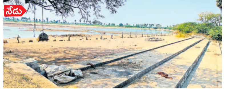
శాలిగారం : ప్రస్తుతం నీళ్ల లేక అడుగంటిన కొత్తపల్లి చెరువు