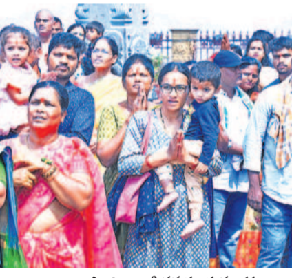
స్వామి వారికి నమస్కరిస్తున్న భక్తులు