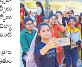
నల్లగొండలో సెల్ఫీ దిగుతున్న విద్యార్థినులు

రామగిరి మార్చి 14 : ఇంటర్మీడియట్ వార్షిక పరీక్షలు గురువారం ముగిశాయి. గురువారం ద్వితీయ సంవత్సరం విద్యార్థులు చివరి పరీక్ష రాశారు. ఈ సందర్భంగా తమ స్నేహితులతో కలిసి ఫోటోలు, సెల్ఫీలు దిగారు. మళ్ళీ కలుద్దామని వీడ్కోలు చెప్పుకొన్నారు. హాస్టల్లో ఉండే విద్యార్థులు తమ సామగ్రి తీసుకొని ఇంటి బాట పట్టారు. ఈ నెల 16 నుంచి జవాబు పత్రాల మూల్యాంకనం ప్రారంభమవుతుంది దీని ఉపశాంతి దసరానాయక్ వెల్లడించారు. తెలుగు, హిందీ, ఇంగ్లీష్, గణితం పాటికల్ సైన్స్ కు సంబంధించి మూల్యాంకనం ఉత్తర్వులు పొందిన అధ్యాపకులు