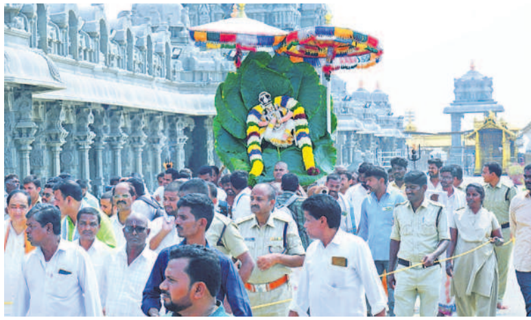
అలయ మాడ వీధుల్లో పట పత్రకాలు అలంకారంలో స్వామి వారి ఊరేగింపు