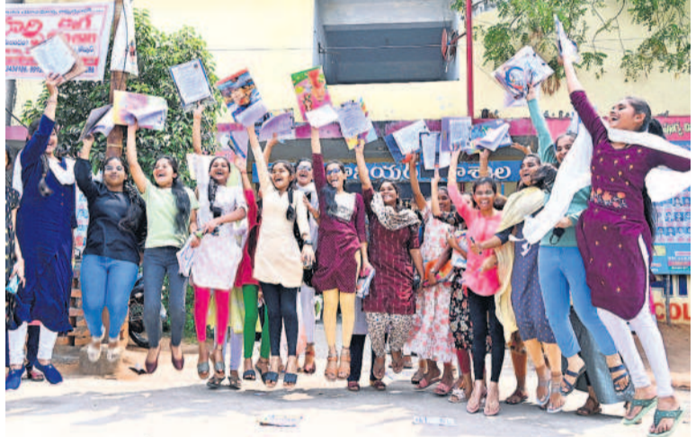
సూర్యాపేటలో కేలంతులు కొడుతున్న విద్యార్థినులు