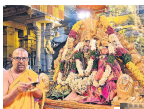
సువర్ణమూర్తులకు హారతి ఇస్తున్న అధ్యక్షుడు

యాదాదిగిరిగట్టు, మార్చి 14 : యాదాదిగిరిగట్టు లక్ష్మీనరసింహస్వామి క్షేత్రంలో స్వామి, అమ్మవార్ల నిత్యోత్సవాలు వైభవంగా జరిగాయి. గురువారం తెల్లవారుజామున ఆలయాన్ని తెరిచిన అధ్యక్షులు సుప్రభాతంలో నరసింహ స్వామిని మేల్కొలిపారు. అనంతరం తిరువారాధన జరిపి ఉదయం ఆరగింపు చేశారు. ప్రధానాలయంలో స్వామి, అమ్మవార్లకు నిజాభిషేకం నిర్వహించారు. స్వామికి తులసి సువాసనామార్చన, అమ్మవారికి కుంకుమార్చన,