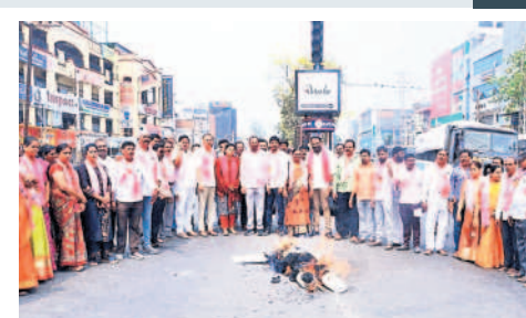
చర్లపల్లి: ఏఎస్రావునగర్ డివిజన్ రాధిక చౌరస్తాలో ..

మల్కాజిగిల, మాల్చ 16: ప్రజలకు మౌలిక వసతులు కల్పిస్తామని డివి