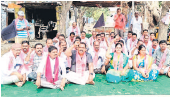
కోడిమ్యాల: నిరదిస్తున్న మాజీ ఎమ్మెల్యే దవీశంకర్ నాయకులు