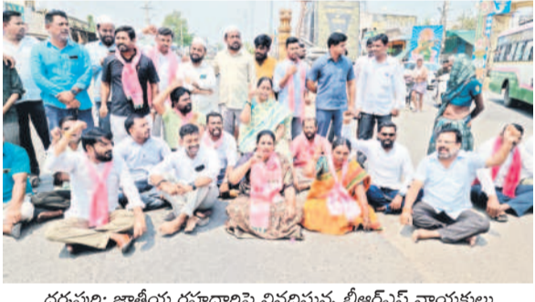
ధర్మపురి: జాతీయ రహదారిపై నిరదిస్తున్న బీఆర్ఎస్ నాయకులు