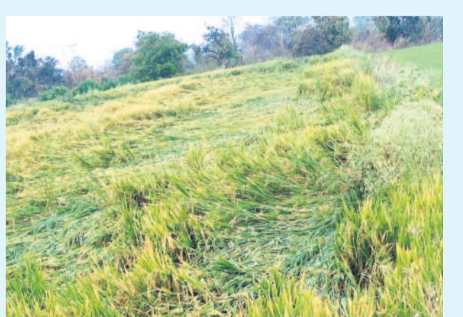
అకాల వాన వీర్యపల్లి: వనపల్లిలో వడగండ్లు వానక ఒలిగిన పరి

కరీంనగర్, మార్చి 16 (నమస్తే తెలంగాణ) : పార్లమెంట్ ఎన్నికల కేంద్ర ఎన్నికల సంఘం శనివారం షెడ్యూల్ విడుదల చేసింది. నాలుగో విడుదలలో మన రాష్ట్రంలో ఎన్నికలు నిర్వహించనుండగా, వచ్చే నెల 18న నోటిఫికేషన్ ఇవ్వనున్నది. ఆదేశాలను 25వ తేదీ వరకు నామినేషన్లు స్వీకరించనున్నాయి. మే 13న పోలింగ్ నిర్వహించి, జూన్ 4న ఓట్ల లెక్కించనున్నారు. ఈ ఎన్నికలకు సంబంధించి కరీంనగర్, పార్లమెంట్ నియోజకవర్గాల్లో ఎన్నికల అధికారులు అన్ని ఏర్పాట్లు చేస్తున్నారు. ఇప్పటికే ఓటరు జాబితాను వెల్లడించారు. రాజకీయ పార్టీల సమక్షంలో ఈవీఎం మిషన్లు పరిశీలించారు. ఎన్నికల అధికారుల పర్యవేక్షణలో సంబంధిత అధికారులు అన్ని ఏర్పాట్లు చేసుకుంటున్నారు.