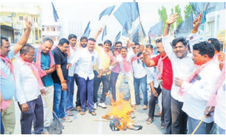
చౌవచంద్ర: మోడీ దిష్టిబొమ్మను దహనం చేస్తున్న బీఆర్ఎస్ నాయకులు

3 కరీంనగర్, ఆదివారం 17 మార్చి 2024 JAGTIAL