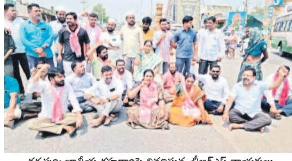
ధర్మపురి: జాతీయ రహదారిపై నిరదిస్తున్న బీఆర్ఎస్ నాయకులు