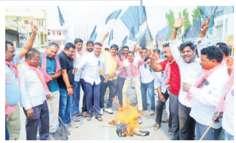
చొప్పడం: మోడీ దిష్టిబొమ్మను దహనం చేస్తున్న బీఆర్ఎస్ నాయకులు