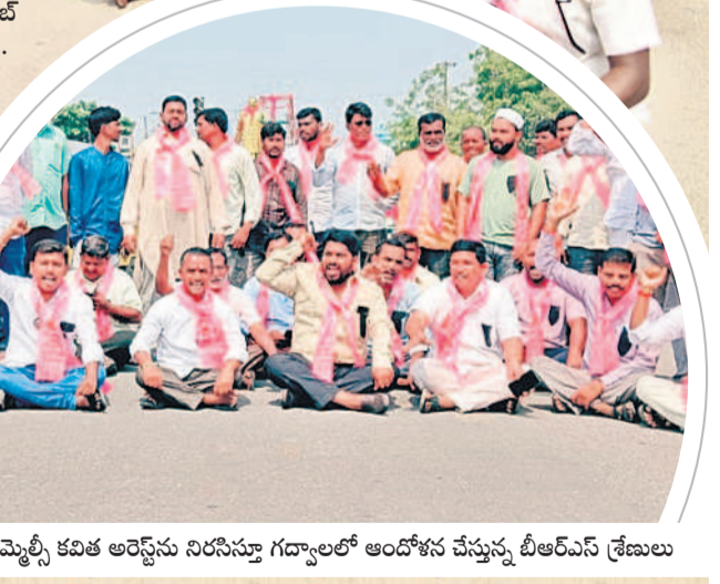
ఎమ్మెల్యే కవిత అరెస్టును నిరసిస్తూ గద్వాలలో ఆందోళన చేస్తున్న బీఆర్ఎస్ శ్రేణులు