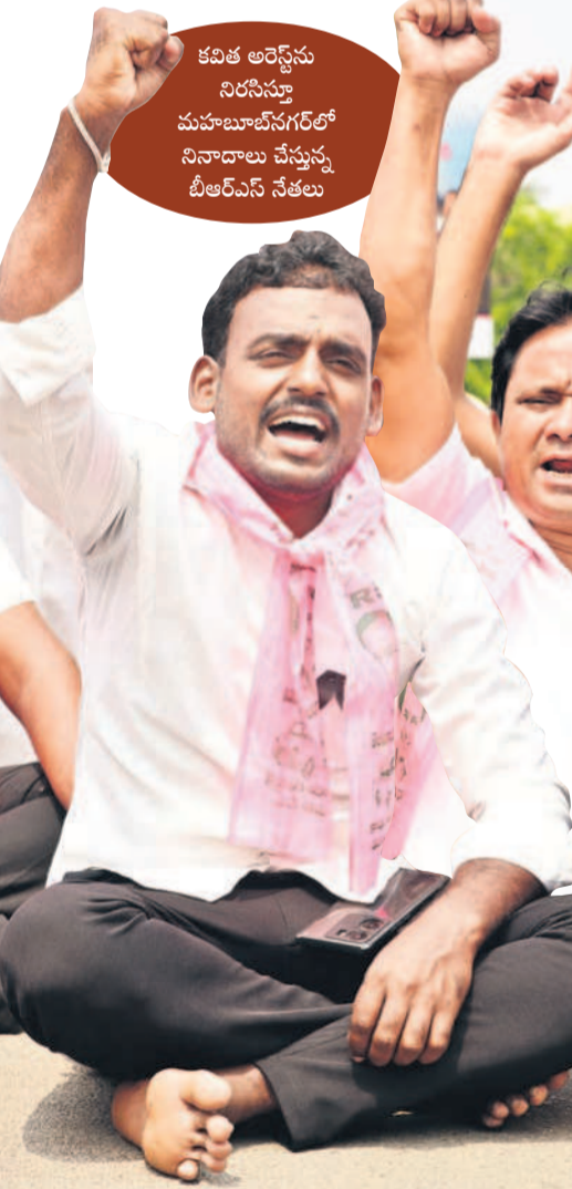
కవిత అరెస్టును నిరసిస్తూ మహబూబ్ నగర్ లో నిరాదాన చిహ్నం బీఆర్ఎస్ నేతలు