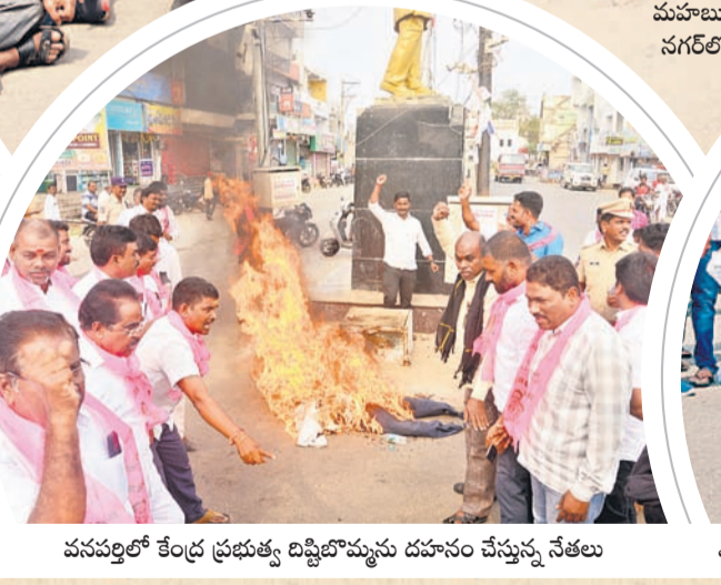
వనపర్తిలో కేంద్ర ప్రభుత్వ దిష్టిబొమ్మను దహనం చేస్తున్న నేతలు