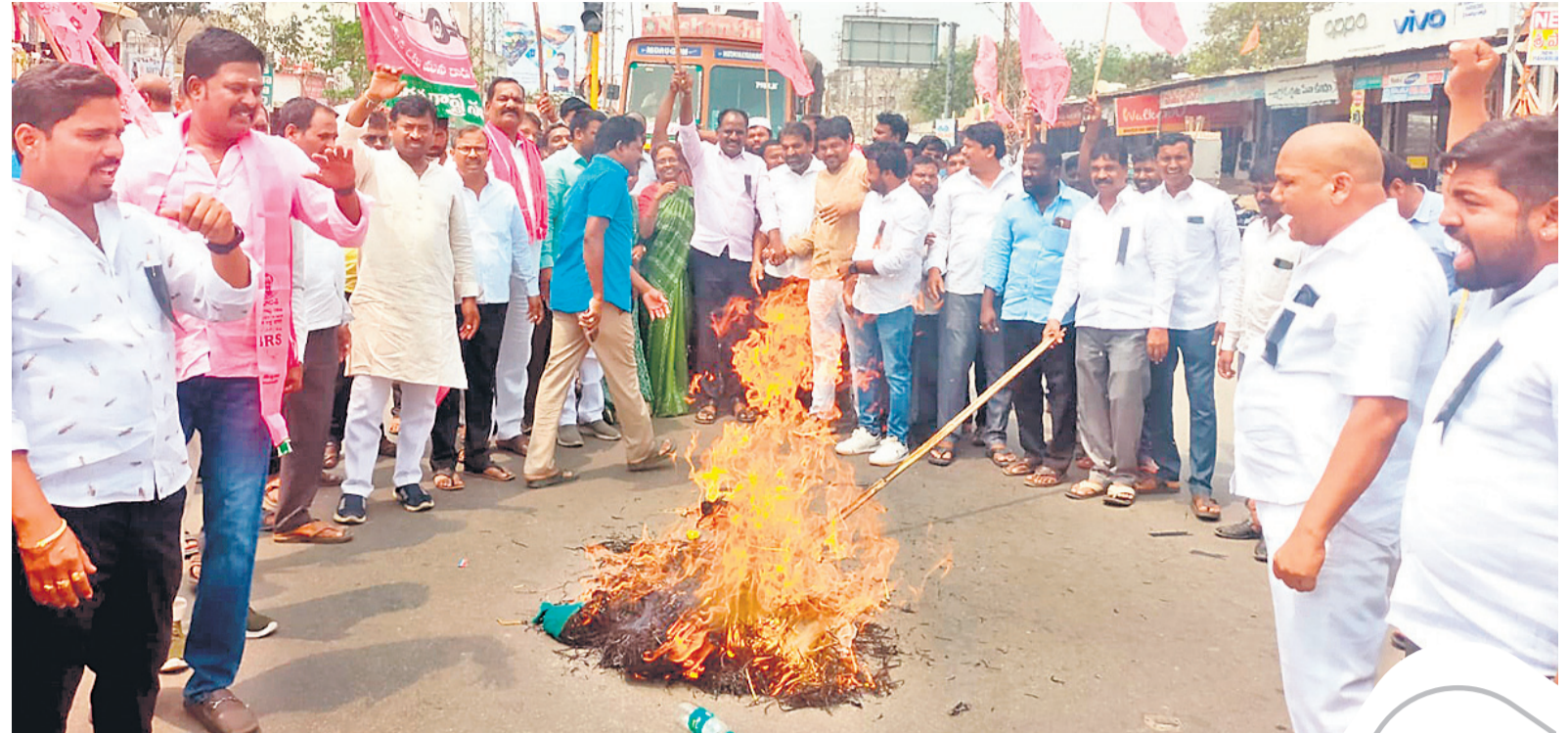
కల్వకుంట్ల పట్టణంలో కేంద్ర ప్రభుత్వ దిష్టిబొమ్మను దహనం చేస్తున్న బీఆర్ఎస్ నాయకులు