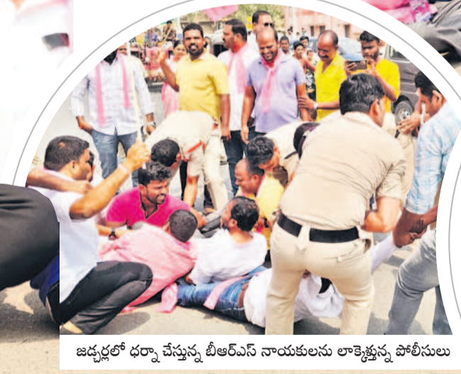
జడ్పీలో ధర్నా చేస్తున్న బీఆర్ఎస్ నాయకులను లాక్కెత్తున్న పోలీసులు