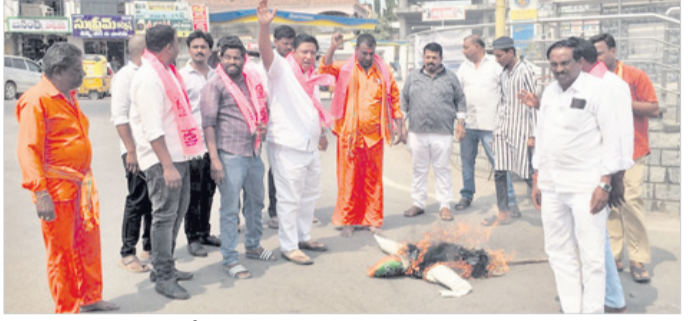
ఆర్కూర్లో మోబి దిష్టిబొమ్మను దహనం చేస్తున్న నాయకులు