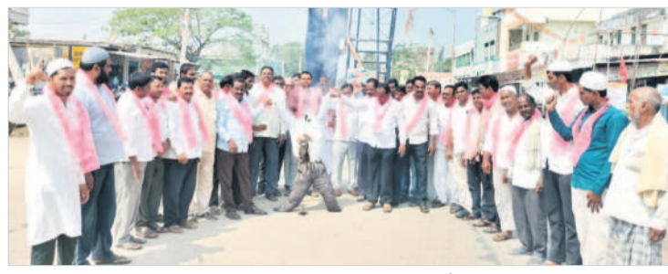
కోటగిరిలో మోబి దిష్టిబొమ్మను దహనం చేస్తున్న బీఆర్ఎస్ నాయకులు