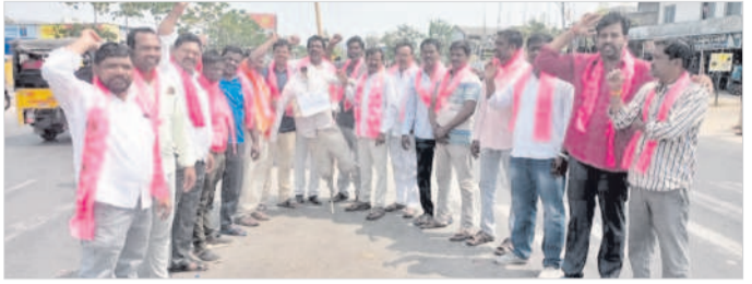
మానిక్ గంగూల్లో మోబి దిష్టిబొమ్మతో ధర్నా..