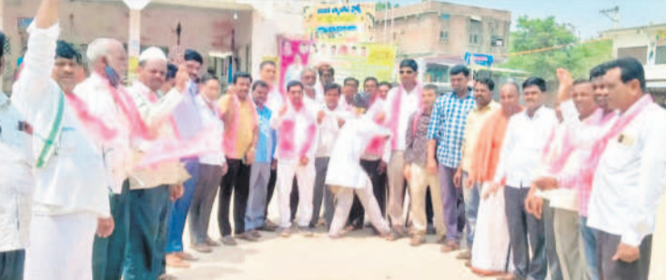
పాతంగిలో మోబి దిష్టిబొమ్మను దహనం చేస్తున్న బీఆర్ఎస్ నాయకులు