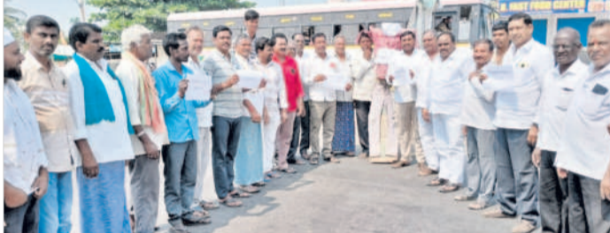
చందూర్లో మోబి, ఈడీ డౌన్ డౌన్ అంటూ ఘోషలు చేస్తున్న నాయకులు