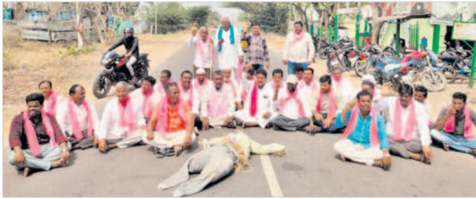
రెంజిల్లో మోబి దిష్టిబొమ్మతో రాస్తారోకో చేస్తున్న బీఆర్ఎస్ నాయకులు