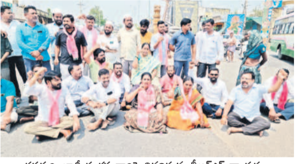
ధర్మపురి: జాతీయ రహదారిపై నిరదిస్తున్న బీఆర్ఎస్ నాయకులు