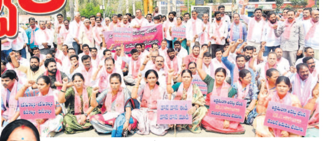
సిరిసిల్లాలో నిరదిస్తున్న నాయకులు, కార్యకర్తలు