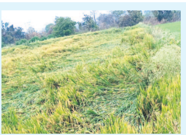
వీరప్పల్లి: వనపల్లిలో వడగండ్ల వానక ఒలిగిన పరి