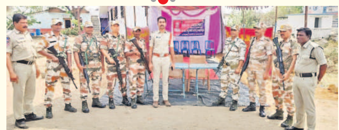
కమ్యూన్ పోలీసులతో ఏర్పాటు చేసిన తెలంగాణ బార్డర్ చెక్ పోస్టు