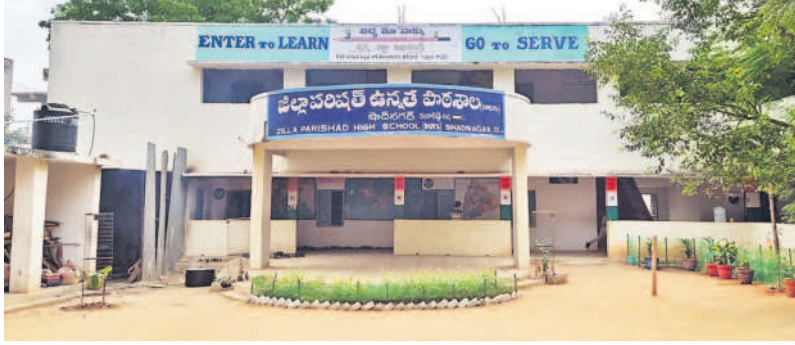
హైదరాబాద్ పట్టణంలోని జిల్లా పరిషత్ ఉన్నత పాఠశాల