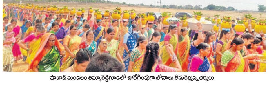
పాల్వూరు మండలం తిమ్మారెడ్డిగూడలో ఊరేగింపుగా బోనాల తీసుకెళ్తున్న భక్తులు

పాల్వూరు, మార్చి 17: షాబాద్ మండలంలోని తిమ్మారెడ్డిగూడ గ్రామంలో మల్లన్న ఉత్సవాలు కనుల పండువగా జరిగాయి. ఆదివారం ఉదయం గ్రామంలోని మల్లన్న దేవాలయం వద్ద వేదపండితుల మంత్రోచ్ఛారణల మధ్య మల్లన్న గొల్లకేమ్మ కల్యాణం నిర్వహించారు. మహిళలు ఊరేగింపుగా బోనాలను తీసుకెళ్లి స్వామివారికి నైవేద్యం సర్పంచారు. పోతరాజుల విన్నాసాలు, శివసత్తుల పూసకాలు, యువకుల కేరింజులు వంటివి పల్లెటూరు మార్చిగింది. భక్తులు స్వామివారికి