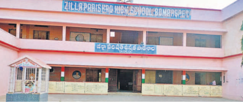
బోంబాయి పేరు జిల్లా ప్రజలపట్ల ఉన్నత పాఠశాల

నీసీ కెమెరాల పర్యవేక్షణలో.. ఉమ్మడి జిల్లాలో పదో తరగతి పరీక్షలను ప్రశాంత వాతావరణంలో నిర్వహించేందుకు అధికార యంత్రాంగం అన్ని ఏర్పాట్లు చేసింది. రంగారెడ్డి జిల్లాలో ప్రతి పరీక్షా కేంద్రానికి ఓ చీఫ్ సూపరింటెండెంట్, ఓ డిప్యూటీ సూపరింటెండెంట్ అధికారిని, అదేవిధంగా జిల్లావ్యాప్తంగా 2,450 మంది