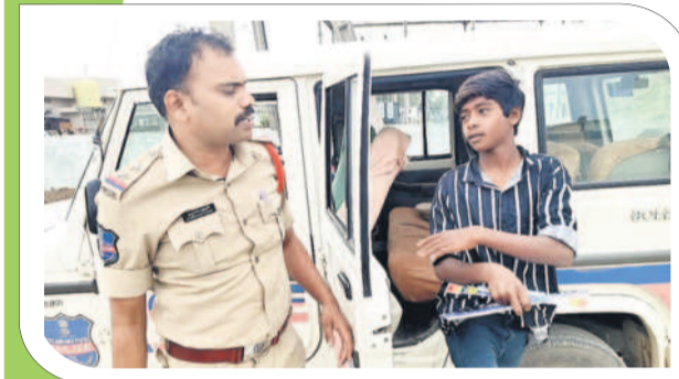
కొత్తగూడెం ఎదుకేపేట : తన వాహనంలో ఓ విద్యార్థిని కేంద్రానికి తీసుకొచ్చిన ఎస్సీ