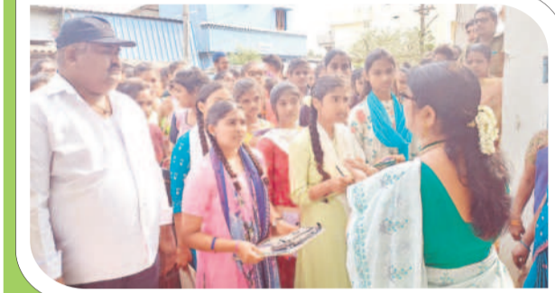
సత్తుపల్లి : పరిశీలన కేంద్రంలోనికి వెళ్తున్న విద్యార్థులు