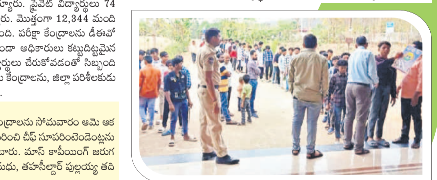
పాల్యాంబ రూరల్ : కిన్నెరసానిలో పరిశీలన కేంద్రాల్లోకి వెళ్తున్న విద్యార్థులు