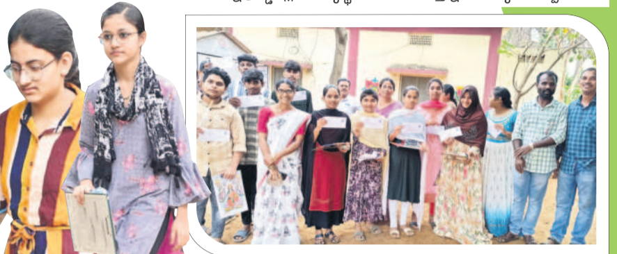
అశ్వారావుపేట టౌన్ : హోల్ టిక్కెట్ల మాపిస్తున్న విద్యార్థులు