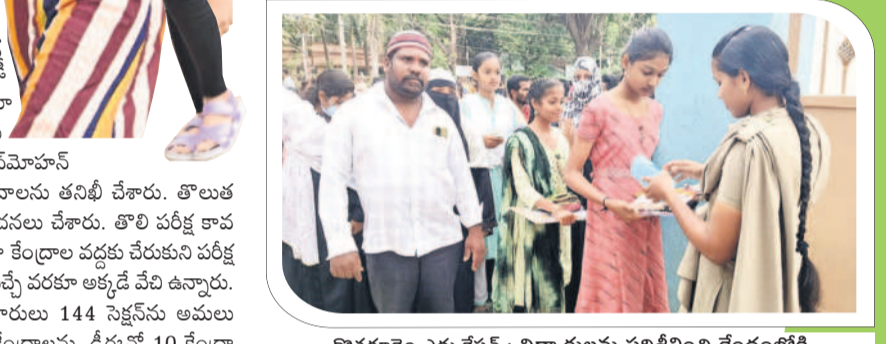
కొత్తగూడెం ఎదుకేపేట : విద్యార్థులను పరిశీలించి కేంద్రాల్లోకి అనుమతిస్తున్న పోలీస్ సిబ్బంది