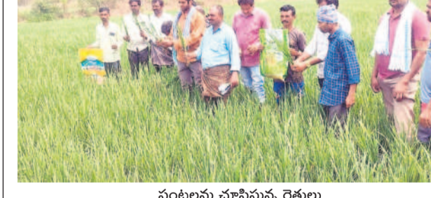
పంటను మాపిస్తున్న రైతులు

50 ఎకరాల్లో వరి పంటను పదిలివేసిన రైతులు ఇల్లందు మండలంలో దుస్థితి.. సర్కార్ న్యాయం చేయాలని డిమాండ్