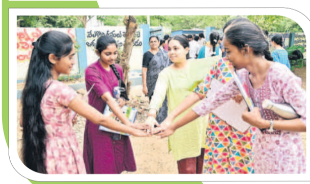
ఖమ్మంలో ఆర్ డి టెన్స్ చెప్పకుండా విద్యార్థులు