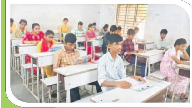
వైరాటోన్ : పరిశీలన కేంద్రాన్ని విద్యార్థులు