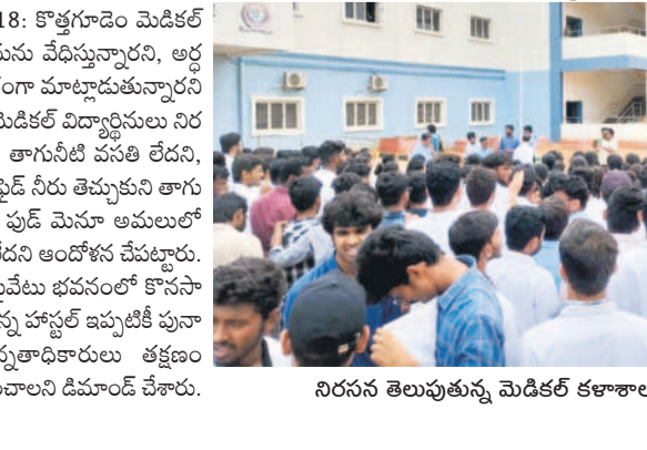
నిరసన తెలుపుతున్న మెడికల్ కళాశాల విద్యార్థినులు