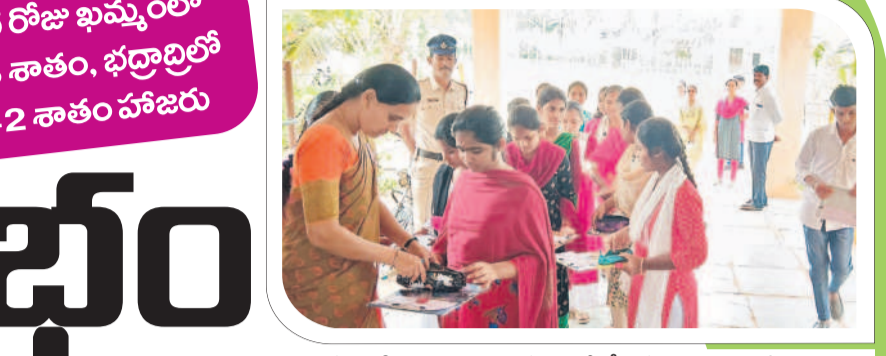
అన్నవరెడ్డిపల్లి : విద్యార్థులను తనిఖీ చేస్తున్న ఉపాధ్యాయ సిబ్బంది