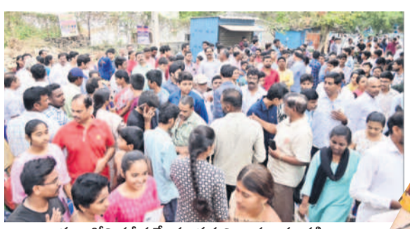
ఖమ్మంలోని పరిశీలన కేంద్రం వద్ద విద్యార్థుల సందడి

ఖమ్మం ఎడ్యుకేషన్, మార్చి 18: తర గతి వార్షిక పరిశీలన ఖమ్మం జిల్లాలో సోమ వారం ప్రశాంతంగా ప్రారంభమయ్యాయి. పరిశీలన ఉదయం 9:30 గంటలకు ప్రారంభం కానుండగా విద్యార్థులు సుమారు గంట ముందుగానే పరిశీలన కేంద్రాలకు చేరుకున్నారు. తొలి వార్షిక పరిశీలన కేంద్రాలను తనిఖీ చేయడానికి డీఈవోలు తమ హోల్ టిక్కెట్లను సైతం ప్రత్యేక పూజలు చేయించుకొని పరిశీలన కేంద్రాలకు చేరుకున్నారు. జిల్లాలో 97 పరిశీలన కేంద్రాల్లో పరిశీలన నిర్వహించారు. తొలిరోజు తెలుగు పరిశీలన మొత్తం 16,582 మంది విద్యార్థులకు గాను 18,543 మంది హాజరయ్యారు. 39 మంది విద్యార్థులు గైర్హాజరయ్యారు. 99.76 శాతం హాజరు నమోదైనట్లు డీఈవో సోమవారం తెలిపారు. ప్రైవేట్లో 58 మంది విద్యార్థులకు గాను 46 మంది హాజరై 12 మంది గైర్హాజరయ్యారు.