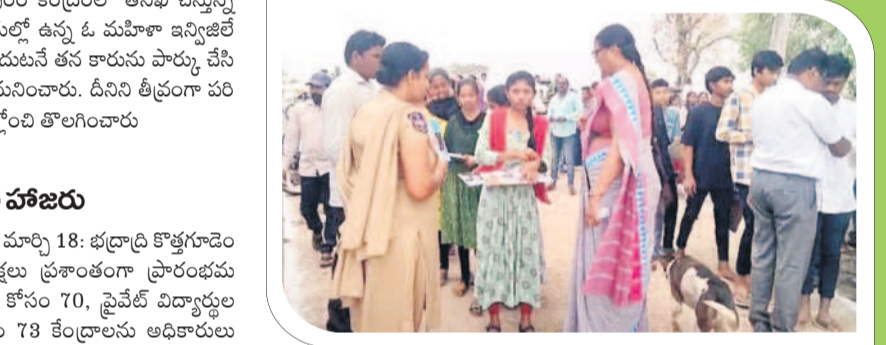
ఇల్లందు రూరల్ : విద్యార్థులను తనిఖీ చేస్తున్న ఉపాధ్యాయులు