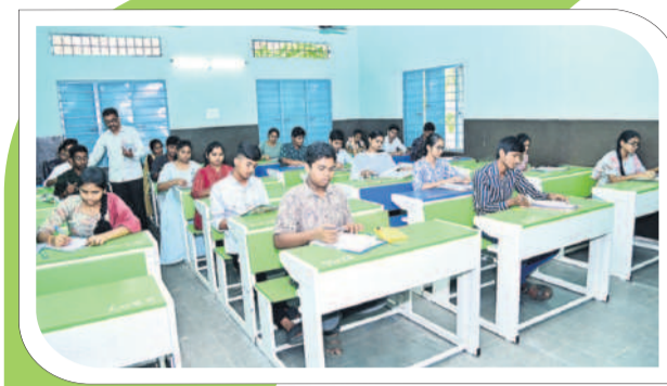
ఖమ్మంలోని ఎన్ఎస్సీ క్యాంపు ప్రభుత్వ పాఠశాలలో పరిశీలన విద్యార్థులు