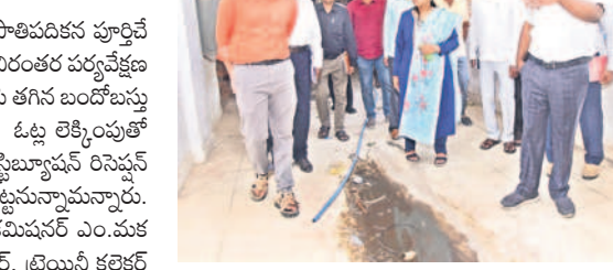
ఏర్పాటు చేసిన పరిశీలిస్తున్న కలెక్టర్ రాజీవ్ గాంధీ హస్తాంతు