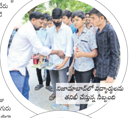
నిజామాబాద్లో విద్యార్థులను తనిఖీ చేస్తున్న సిబ్బంది