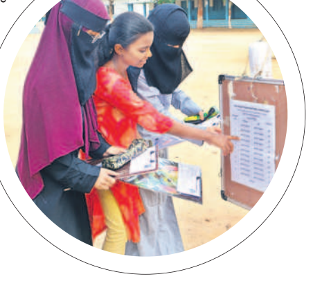
దేవునిపల్లిలో హాల్టికెట్ సంబంధ చూసుకుంటున్న విద్యార్థులు