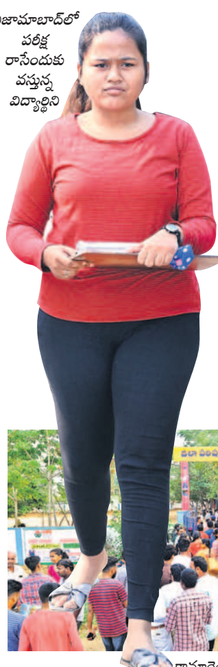
నిజామాబాద్లో పరీక్ష రాసేందుకు వస్తున్న విద్యార్థిని

పది పరీక్షలు షురూ నిజామాబాద్లో 21,870, కామారెడ్డిలో 11,940 మంది హాజరు పరీక్షా కేంద్రాలను తనిఖీ చేసిన కలెక్టర్, అధికారులు