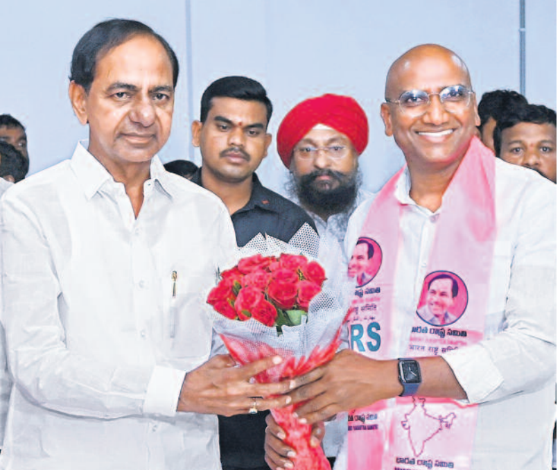
హైదరాబాద్, మార్చి 18 (నమస్తే తెలంగాణ): తెలంగాణ చైతన్యాన్ని ఆగం కానివ్వలేమని బీఆర్ఎస్ అధినేత కేసీఆర్ స్పష్టం చేశారు. బీఆర్ఎస్ పార్టీ బహుజన రాష్ట్ర సమితిగా తెలంగాణలోని దళిత, బహుజన వర్గాలకు గొంతుగా నిలుస్తుందని అన్నారు. కమిటీమెంబర్లతో ముందుకు సాగితే సాధించలేనిది ఏమీ ఉండదని తెలిపారు. తన రాజకీయ జీవితంలో 14 ఏండ్లు తెలంగాణ రాష్ట్ర సాధన కోసం, 10 ఏండ్లు తెలంగాణ రాష్ట్ర ప్రజల యోగక్షేమాని కోసం అవరోధాలు భయంభానని చెప్పారు. తెలంగాణ > 2వ పేజీలో