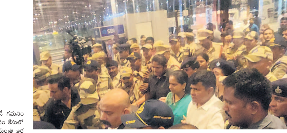
పైను? బీజేపీతో ఏకీభవించని వారిపైన, ప్రతిపక్షాలపైన. ఆ పార్టీకి లొంగిపోయిన. ఎవరైనా కేసులకు, చాటుకు భయపడి ఆ తర్వాత లొంగిపోవడం వల్ల కేసులు వెంటనే రద్దవుతున్నాయి లేదా నిరపదికంగా పెండింగులో పడుతున్నాయి.