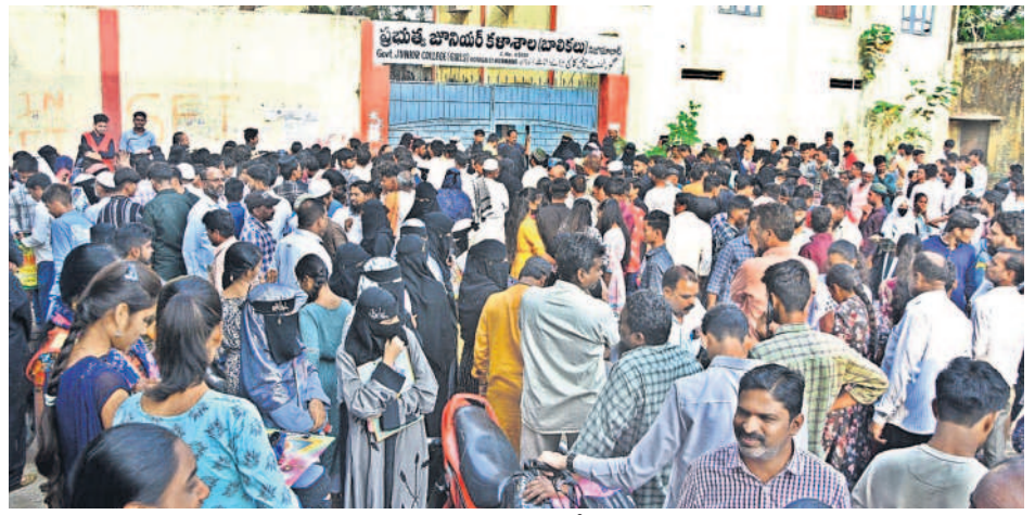
నిజామాబాద్లో ఓ సెంటర్ ఎదుట విద్యార్థులు, తల్లిదండ్రుల సందడి