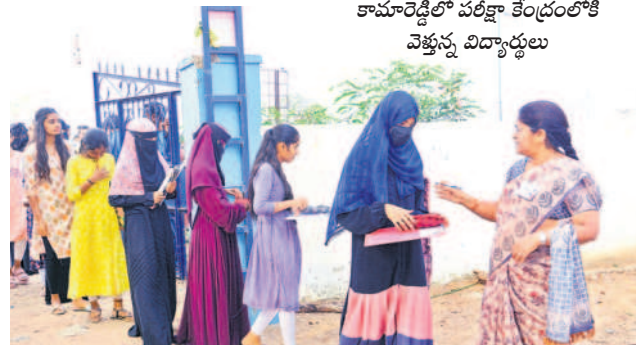
కామారెడ్డిలో పరీక్షా కేంద్రంలోకి వెళ్తున్న విద్యార్థులు

అధికారులు, ప్రజా ప్రతినిధుల ఎదుట ఆవేదన వెలిబుచ్చుతున్నారు. పంట నష్ట పరిష్కారం ద్వారా రైతులకు సాంత్వనం చేశారేందుకు తెలం గాణ ప్రభుత్వం యుద్ధ ప్రాతిప దికన ఏర్పాటు చేయాలన్నీ ఉన్న పుటికి ఈ అంశంపై అతీగతీ లేకుండా పోయింది. సకాలలో పరిహారం అందివ్వడం ద్వారా కర్షకుడి కన్నీటిని తుడి చేలా తెలంగాణ వ్యవసాయ శాఖ ప్రయత్నిస్తే బాగుండేది. కానీ రైతులుండు పెట్టుబడి సహ యాన్ని కొర్రల పెట్టి కొంత మందికి సాయం అందించిన కాంగ్రెస్ సర్కారుకు పంట నష్టపో యన రైతులపై ప్రేమ పుడుతుందా? అన్న ప్రశ్న ఇప్పుడు ఉత్పన్నం అవుతోంది.