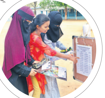
దేవునిపల్లిలో హాల్టికెట్ సెంటర్ మానుకుంటున్న విద్యార్థులు