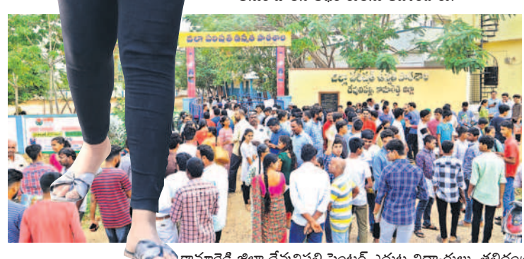
కామారెడ్డి జిల్లా దేవునిపల్లి సెంటర్ ఎదుట విద్యార్థులు, తల్లిదండ్రుల సందడి

నిజామాబాద్లో 21,870, కామారెడ్డిలో 11,940 మంది హాజరు పరీక్షా కేంద్రాలను తనిఖీ చేసిన కలెక్టర్, అధికారులు