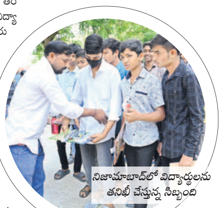
నిజామాబాద్లో విద్యార్థులను తనిఖీ చేస్తున్న సిబ్బంది