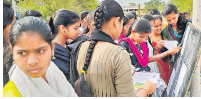
బొంబాయి: హాట్ టెంట్ సందర్భం చూసుకుంటున్న విద్యార్థులు