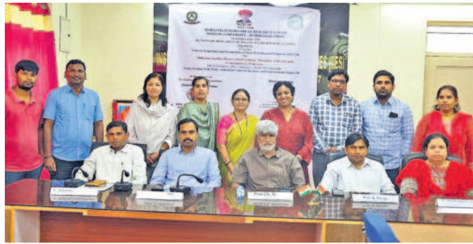
సింపోజియం ప్రారంభోత్సవానికి హాజరైన అతిథులు, నిర్వాహకులు