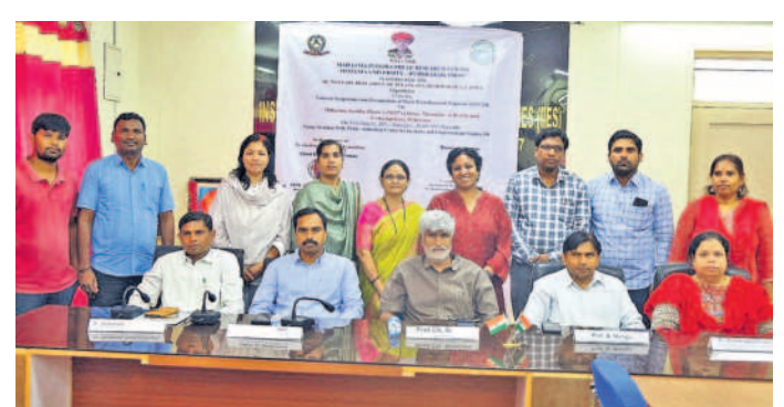
సింపోజియం ప్రారంభోత్సవానికి హాజరైన అతిథులు, నిర్వాహకులు