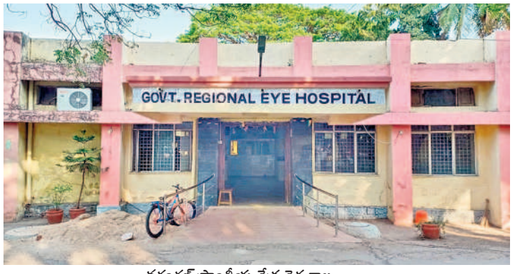
వరంగల్ ప్రాంతీయ నేత్ర వైద్యశాల