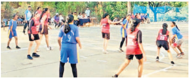
ఎట్టి కాలేజీలో బాస్కెట్బాల్ ఆడుతున్న విద్యార్థులు