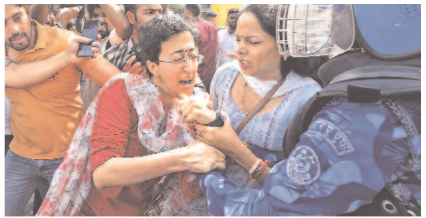
సీఎం అరవింద్ కేజ్రీవార్ ను ఎన్.పో.వో.మెంట్ డైరెక్టరేట్ అరెస్టు చేయడాన్ని నిరసిస్తూ శుక్రవారం ఢిల్లీలో ఆప్ చేపట్టిన ఆందోళనలో ఆ రాష్ట్ర మంత్రి అతిథి పోలీసుల దౌర్జన్యం

కేజ్రీవార్ అరెస్టుపై దేశవ్యాప్తంగా నిరసన ఢిల్లీలో ఇద్దరు ఆప్ మంత్రుల అరెస్టు పోలీసుల అదుపులో అతిథి, సౌరభ భరద్వాజ్ 28 వరకు ఈ డి.సీ.బి సీఎం కేజ్రీవార్ 7 రోజులపాటు రౌస్ అవెన్యూ కోర్టు అనుమతి మధ్యం పాలసీ ప్రధాన కుట్రదారు ఆయనే: ఈ డి.సీ.బి ఆధారాలు లేని ఆరోపణలను కేజ్రీవార్ లాయర్లు జైల్లో ఉన్నా సేవ కొనసాగిస్తానన్న ఆప్ అధినేత సీఎంగా తొలగించాలి: ఢిల్లీ హైకోర్టులో పిటిషన్ బీజేపీకి ప్రజల బుద్ధి చెప్పారు: మమతా బెనర్జీ న్యూఢిల్లీ, మార్చి 22: ఢిల్లీ సీఎం, ఆప్ కన్వీనర్ అరవింద్ కేజ్రీవార్ అరెస్టుకు వ్యతిరేకంగా ఆప్ నేతలు, కార్యకర్తలు ఢిల్లీ సహా దేశవ్యాప్తంగా పెద్ద ఎత్తున నిరసనలు చేపట్టారు. కేంద్రంలోని అధికార బీజేపీకి వ్యతిరేకంగా నివాదాలు చేశారు. ఢిల్లీలోని ఐటీఐ ఇంక్స్ వద్ద ఆందోళనకు దిగిన ఆప్ మంత్రులు అతిథి, సౌరభ భరద్వాజ్ లను పోలీసులు అరెస్టు చేశారు. పంజాబ్ విద్యా శాఖ మంత్రి హర్నాల్ సింగ్ బైన్స్ ను కూడా అదుపులోకి తీసుకొన్నారు. మరోవైపు కేజ్రీవార్ అరెస్టుకు నిరసనగా ఈ నెల 26న ప్రధాని మోదీ నివాసం ముట్టడికి >9వ పేజీలో