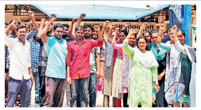
మంబిల్వాలలో భర్తా నిర్వహిస్తున్న టీఎ.డీ.ఏ. అభ్యర్థులు

కిలకమైన విషయంపై విద్యార్థులు నొక్కుబడిగా కఠినంగా, ఈ విషయాన్ని ప్రాధికారికి వివరించడం గమనార్హం. గతంలో బీబీఎస్ఎఫ్లో నిర్వహించడం వల్ల అభ్యర్థులందరికీ ఒకే ప్రశ్నపత్రాన్నిచ్చారు.