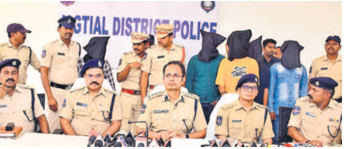
జగిత్యాలలో నిందితుల అరెస్టును చూపుతున్న ఎస్సీ సన్ స్ప్రీమ్ సింగ్