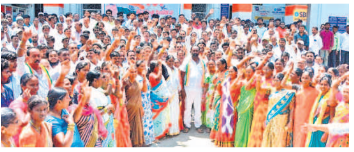
గాంధీభవన్ ఎదుట ఆందోళన చేస్తున్న పెద్ద కృష్ణమూర్తి వర్గం

నీలగిరి, మార్చి 23: కారాగృహ అధికారి లోకి వచ్చి వంద రోజులు దాటి.. ఒక్క గ్యాంప్ తింటుంటే అమలు చేయలేదని ప్రజాశాంతి పార్టీ అధ్యక్షుడు కేపి పాల్ విమర్శించారు.