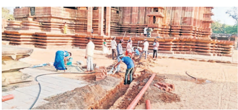
సోమనూత్రం పునరుద్ధరణలో భాగంగా వైపులు వేస్తున్న సిబ్బంది