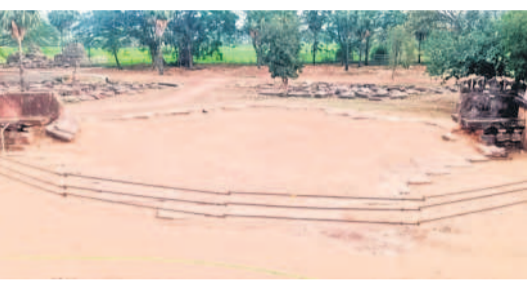
కామేశ్వరాలయం నిర్మాణం జరిగే ప్రదేశం

త్వరలో కామేశ్వరాలయం పనులు ప్రారంభం కామేశ్వరాలయంతో పాటు, ఆగ్నేయ దిశలో సగం వరకు కూలిన ప్రహారీ నిర్మాణానికి పురావస్తు శాఖ అధికారులు చర్యలు తీసుకుంటున్నారు. గతంలోనే కామేశ్వరాలయం పునరుద్ధరణకు కేంద్ర పురావస్తు శాఖ రూ.11కోట్లు మంజూరు చేయగా త్వరలోనే పనులు ప్రారంభించేందుకు సన్నాహాలు చేస్తున్నారు.