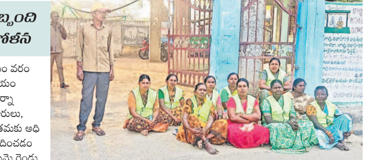
పద్మనాభ మున్సిపల్ కార్యాలయం ఎదుట ధర్మా చేస్తున్న పారిశుధ్య కార్మికులు

పద్మనాభ, మార్చి 23 : వేతనాల కోసం వరంగల్ జిల్లా పద్మనాభ మున్సిపల్ కార్యాలయం ఎదుట పారిశుధ్య కార్మికులు శనివారం ధర్మా చేశారు. నిత్యం తెల్లవారుజామునే రహదారులు, అంతర్గత రోడ్లు, డ్రైనేజీలను శుభ్రం చేసే తమకు అధికారులు నాలుగు నెలలుగా వేతనాలు అందించడం లేదని ఆందోళన వ్యక్తం చేశారు. ఈ విషయంపై రెండు నెలల క్రితం మున్సిపల్ కార్యాలయం ముందు భైతాయింది నిరసన తెలిపారు. అయినప్పటికీ మున్సిపల్ అధికారులు పట్టించుకోవడం లేదు. నెలలుగా వేతనాలు అధికంగా తీవ్ర ఇబ్బందులకు గురవుతున్నామని పేర్కొన్నారు. వేతనాల విషయంలో అధికారులు నిర్లక్ష్యంగా వ్యవహరిస్తున్నా పాలక మండలి