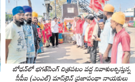
సీపీఐ (ఎంఎల్) మాస్ల్రెన్ ప్రజాపంథా నాయకులు