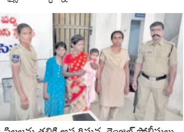
పిల్లలను తల్లికి అప్పగిస్తున్న రెంజల్ పోలీసులు