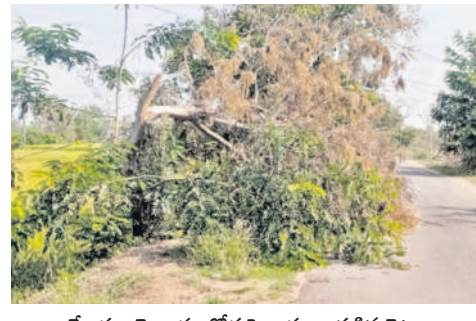
ತೆಸ್ರಾರಂ ಕ್ರಾಪ್ತ್ ಅಜ್ಞಂಗ್ ಪಡಿನ ವಿಟ್ಟು

ధర్పల్లి, మార్చి 23 : రోడ్డుకు అడ్డంగా చెట్టు కూలి పక్షం రోజులు గడుస్తున్నా పట్టించుకునే వారు లేక ప్రయాణికులు ఇబ్బందులు పడుతున్నారు. ఇటీవల కురిసిన అకాల వర్షం, ఈదురుగాలులకు మండలంలోని కేశారం నుంచి మైలారం గ్రామానికి వెళ్లే దారిలో పెద్ద చెట్టు రోడ్డుపై నేలకొరిగింది. సుమారు 15 రోజులు కావస్తున్నా పంచాయతీ అధికారులు గానీ, ఆర్అండ్బీ అధికారులు గానీ పట్టిం చుకోకపోవడంతో ప్రయాణికులు ఇబ్బందులకు గురవుతున్నారు. ట్రమాదాలు చోటుచేసుకోకముందే అధికారులు స్పందించి, చెట్టును తొలగించాలని ప్రయాణికులు కోరుతున్నారు.