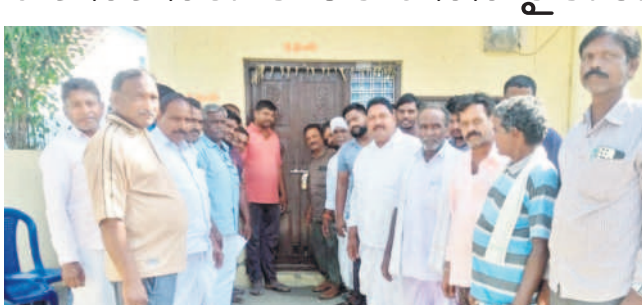
కోనసముందర్ పీఏసీఎస్కు తాళం వేస్తున్న రైతులు